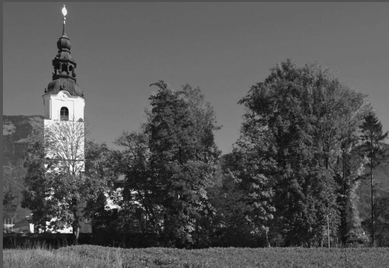
Župnijska cerkev sv. Petra v Preddvoru