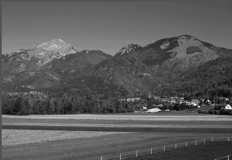
Preddvor z okolico