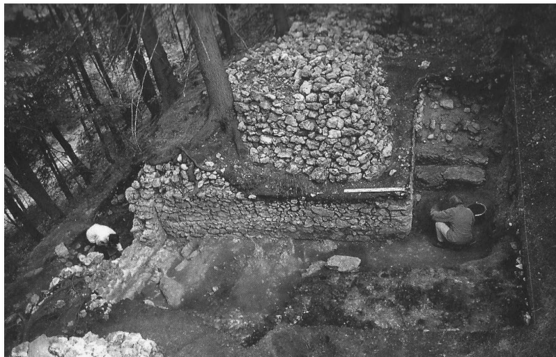
Na mestu Ložarjevega izkopa so leta 1998 ponovno izkopavali sodelavci Narodnega muzeja Slovenije iz Ljubljane.

V zavetju visokih gora so Stari Slovani v starejši kameni dobi postavili gradišče, ki leži nad Bašljem (865m). Arheologi so tu našli staroslovansko keramiko, bakrene in železne ostroge iz 8. in 9. stoletja. Na njih se kažejo frankovski vplivi. Postojanka je imela izrazit vojaški pomen.