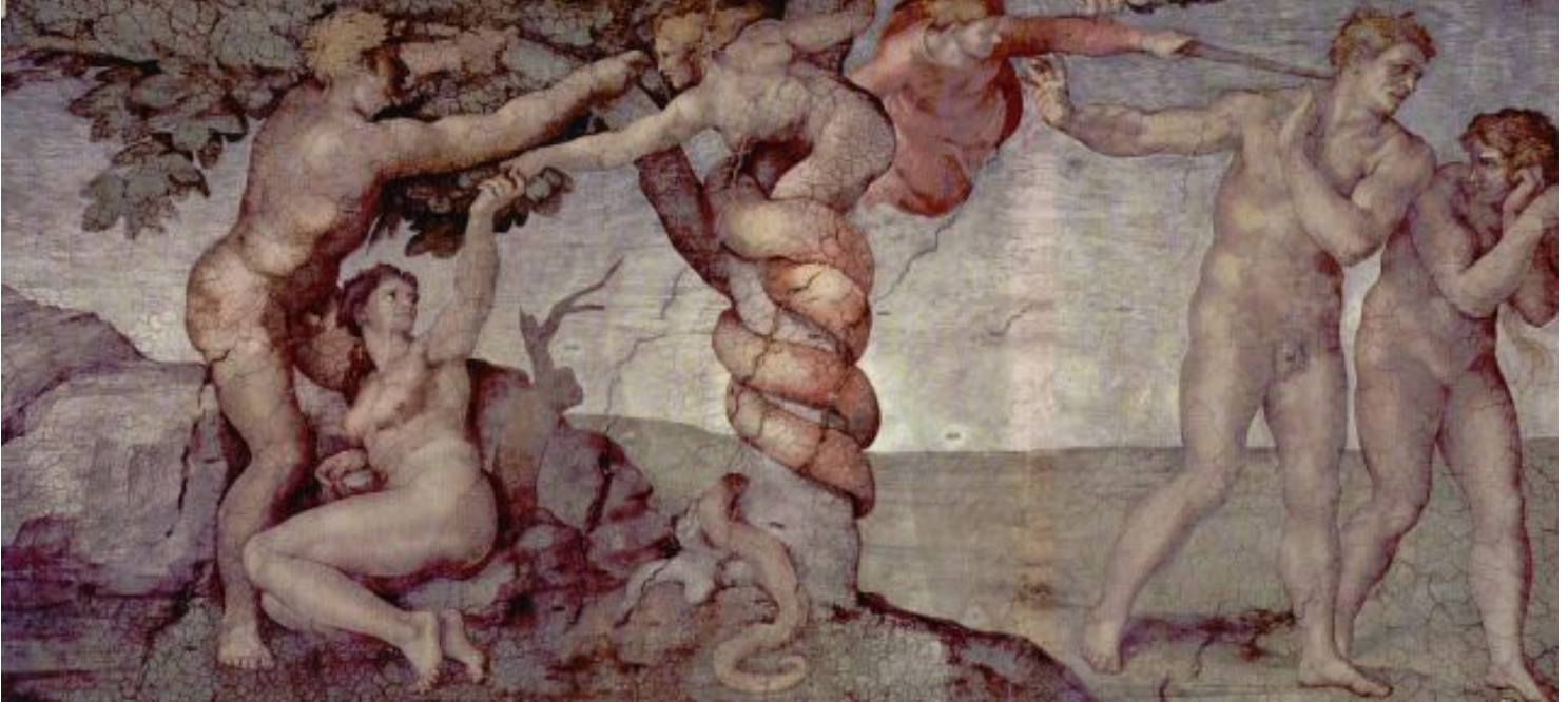
Michelangelo Buonarroti: Izvirni greh in izgon iz raja, strop Sikstinske kapele (1508–1512)