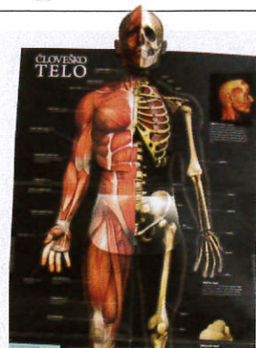
3D plakat iz knjige

možganov in živčevja, osnovna čutila, pljuča, obtočila in vse drugo, kar »sestavlja« človeka. Ste vedeli, da je človeško telo zgrajeno iz približno 50 trilijonov mikroskopsko majhnih gradnikov, ki se imenujejo celice, ali da človek v enem dnevu vdihne približno 20.000-krat? V notranjosti slikovno bogate knjige je šest posebnih hologramskih slik, ki spreminjajo obliko, dodan pa je še velik 3D-plakat človeškega telesa. Zabavno raziskovanje vam želim. > RENATE RUGELJ