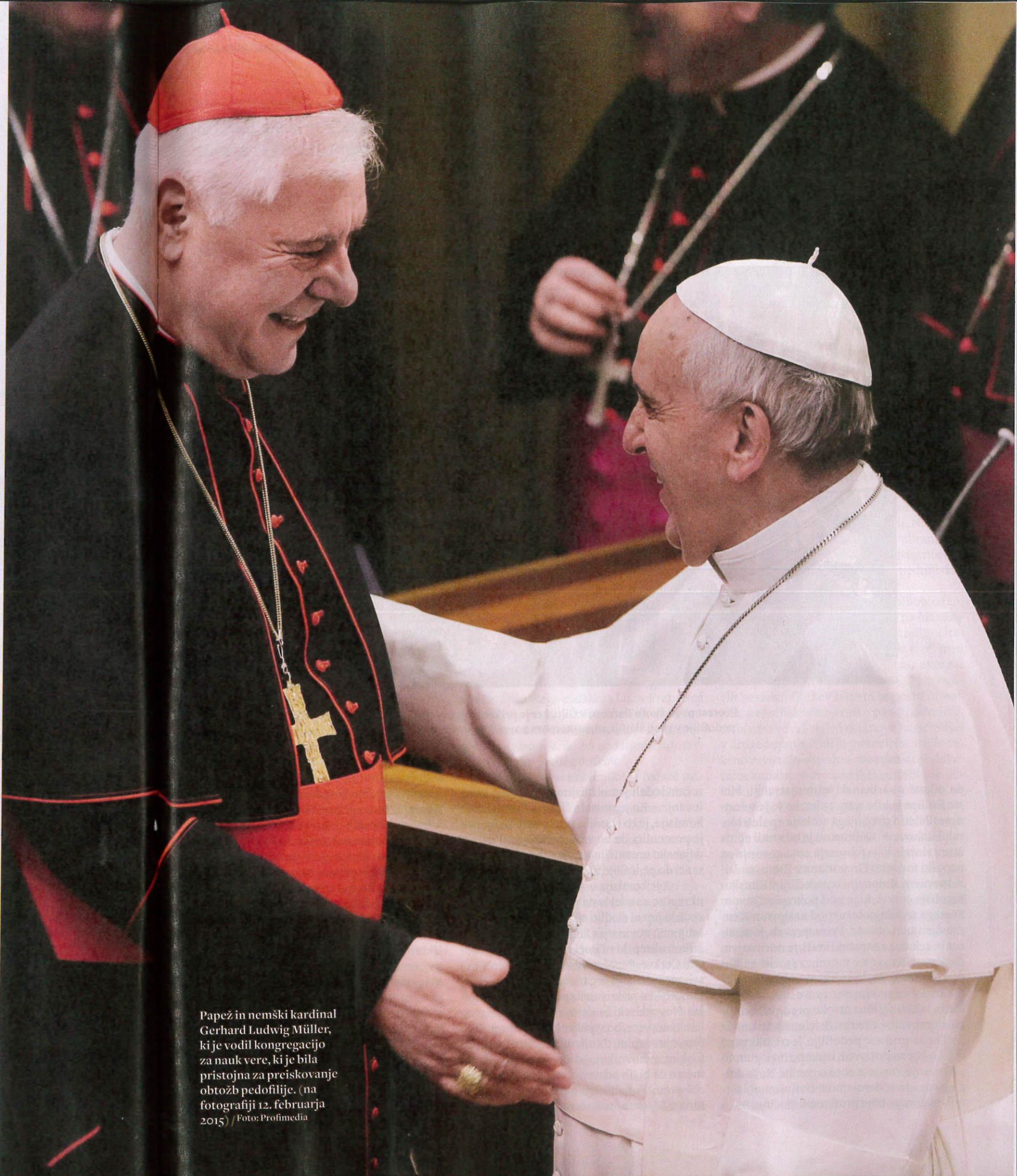
Papež in nemški kardinal Gerhard Ludwig Müller, ki je vodil kongregacijo za nauk vere, ki je bila pristojna za preiskovanje obtožb pedofilije. (na fotografiji 12. februarja 2015)

Po treh letih je komisija ostala brez obeh članov, ki sta ji dajala največjo verodostojnost, saj sta bila nekdanji žrtvi pedofilskih duhovnikov. Oba sta odstopila, ker sta menila, da je komisija zgolj fasada brez pooblastil, saj so pozivi k večjim možnostim za ukrepanje naleteli