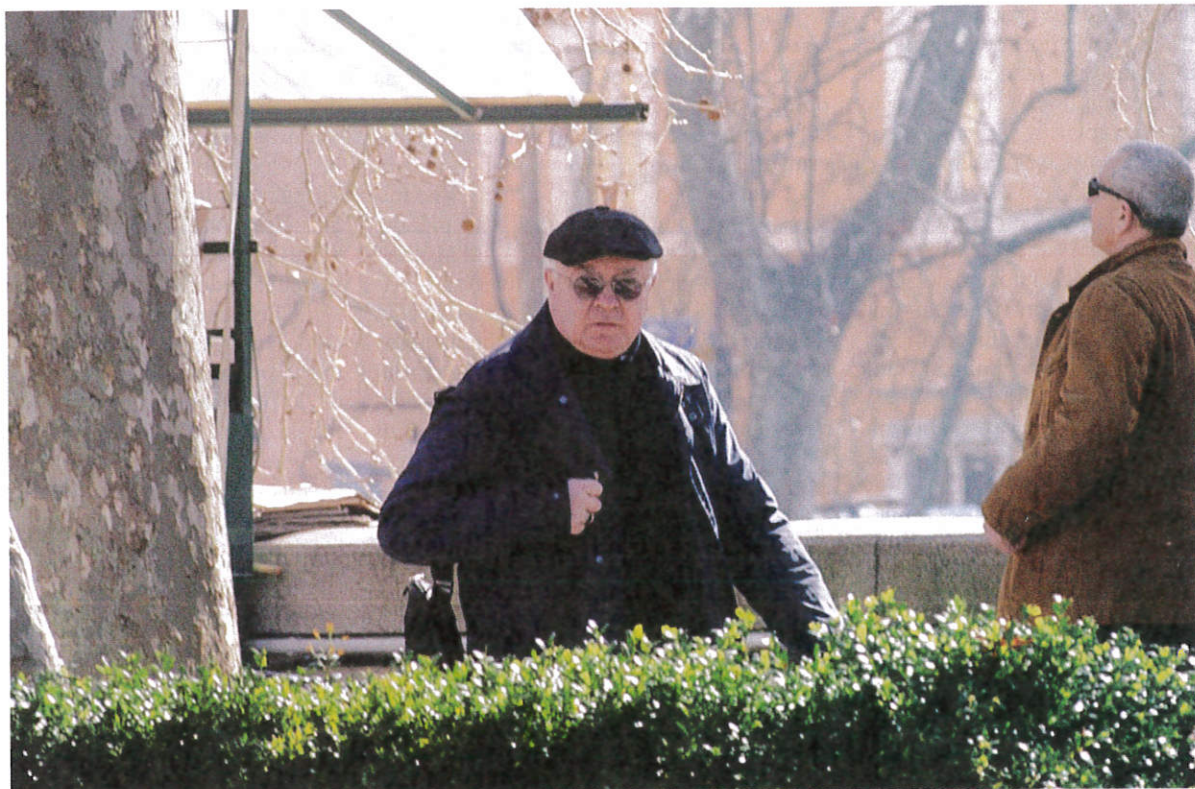
Nekdanji visoki vatikanski diplomat in poljski nadškof Józef Wesółowski, ki je bil obtožen spolne zlorabe otrok v času, ko je bil nuncij v Dominikanski republiki.

Pri ukrepanju proti spolni zlorabi otrok v Katoliški cerkvi obstaja prejšnj in potem. Za prelomnico štejemo leto 2010, ko je bil papež Benedikt XVI. Pred tem so se v Vatikanu držali načela, da bodo posamezne škofije same poskrbele zase, še najboljše tako, da bodo molčale.