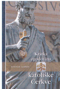
Družina, Ljubljana 2013, 340 strani, 29,50 evra