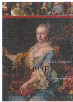
Cankarjeva založba, Ljubljana 2013, 263 strani, 49,95 evra