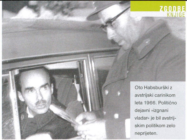
Oto Habsburški z avstrijskim carinikom leta 1966. Politično dejavni »izgnani vladar« je bil avstrijskim politikom zelo neprijeten.