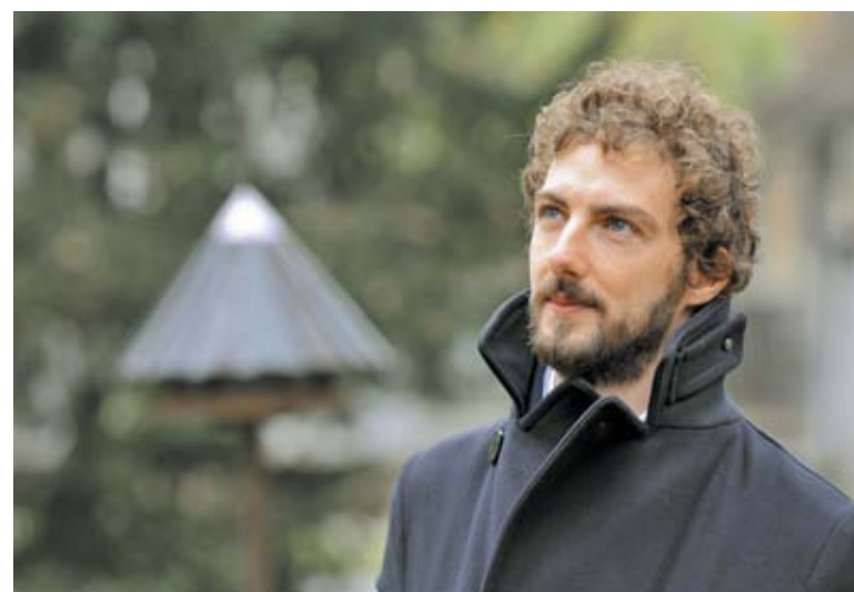
Avtor knjige Alessandro D'Avenia