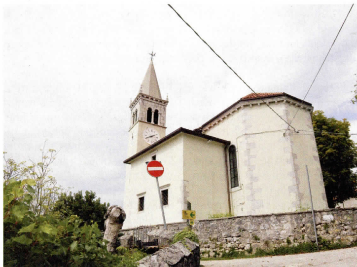
Cerkev v Šempolaju, Grudnovem rojstnem kraju