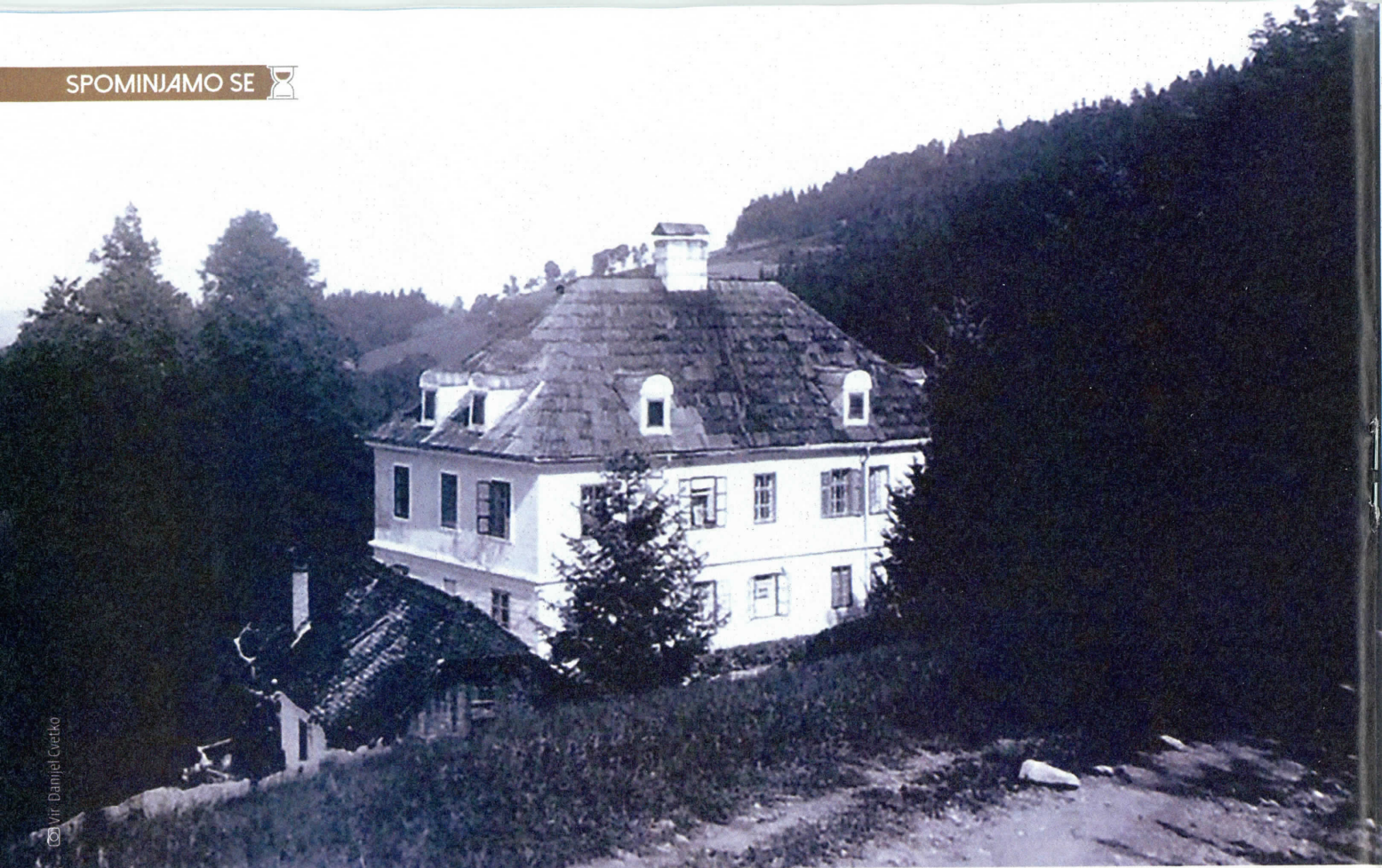
Lenarčičev dvorec v Josipdolu, ki so ga leta 1943 požgali partizani.

▶ ona veliko premikala med Milanom, Trstom, Ljubljano in Opatijo.