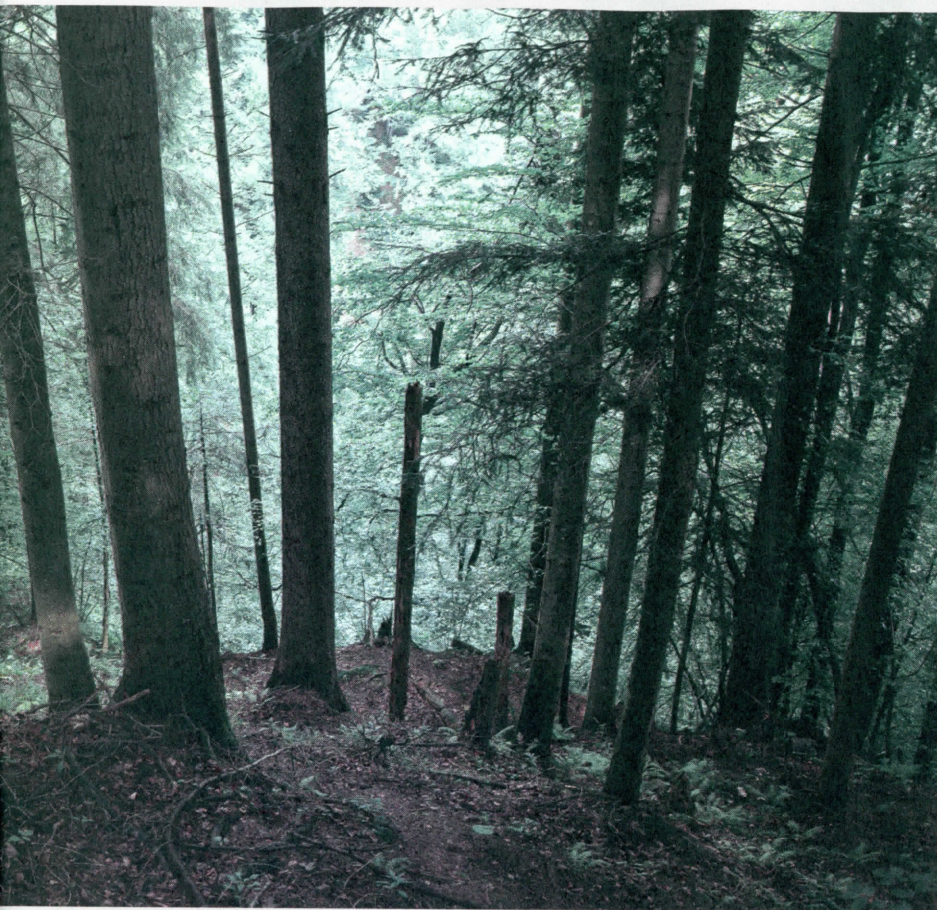
Prizorišče zločina: temačna Štulčeva grapa.