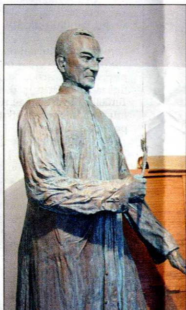
Kip Mirsada Begića že dve leti čaka na postavitve v garaži v Šturjah

Terčelj je v Campobassu ostal brez denarja, zato so ga patri kapucini postavili na cesto in prvo noč je prespal na klopci v parku. Potem se ga je usmilil komandir