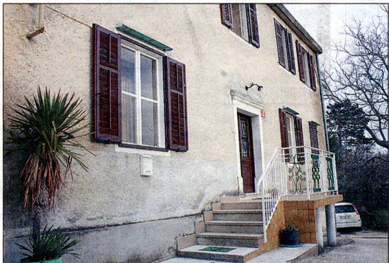
Rojstna hiša stoji v Grivčah, od koder se ponuja prelep razgled na Čaven, Školj in Ajdovščino. Terčelj je na dom rad povabil svoje prijatelje, ki imajo Grivče zaradi gostoljubnosti v zelo lepem spominu.