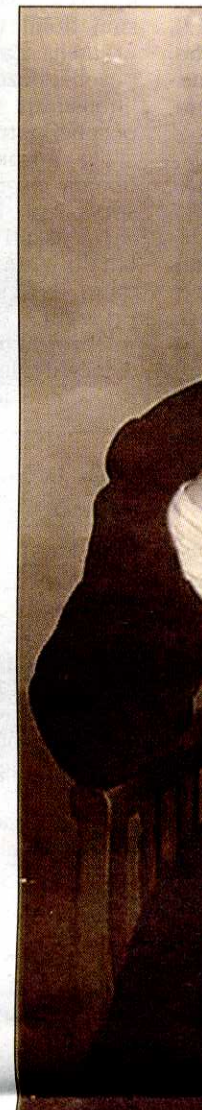
Terčelj na fotografiji v Ljubljani in Kölnu

prinesla izrezek časopisa, ki je Dobro se spomni pisalo: Za Slovenjenci so ga ubili.