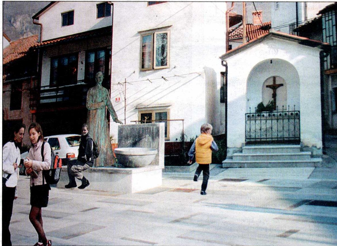
Fotomontaža kaže, kako bo trg v Šturjah videti konec aprila, ko bodo Terčelju slednjič le odkrili spomenik

Pregnanstvo se je končalo že nekaj mesecev kasneje s pomilostitvijo zaradi desete obletnice ustanovitve fašistične stranke. Vrnil