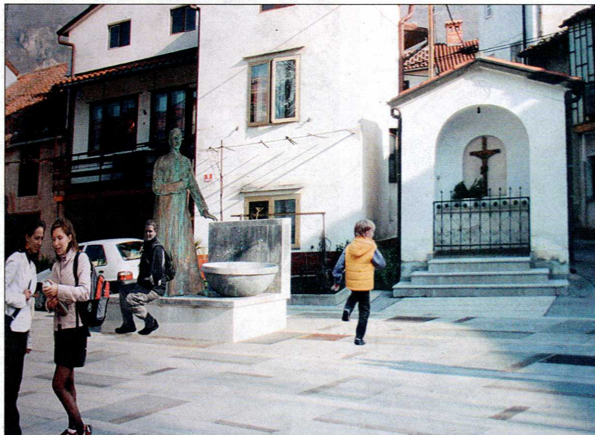
Fotomontaža kaže, kako bo trg v Šturjah videti konec aprila, ko bodo Terčelju slednjič le odkrili spomenik

Pregnanstvo se je končalo že nekaj mesecev kasneje s pomilostitvijo zaradi desete obletnice ustanovitve fašistične stranke. Vrnil