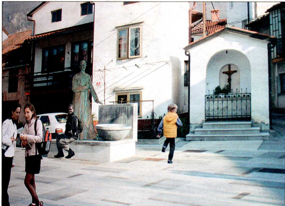
Fotomontaža kaže, kako bo trg v Šturjah videti konec aprila, ko bodo Terčelju slednjič le odkrili spomenik

Pregnanstvo se je končalo že nekaj mesecev kasneje s pomilostitvijo zaradi desete obletnice ustanovitve fašistične stranke. Vrnil