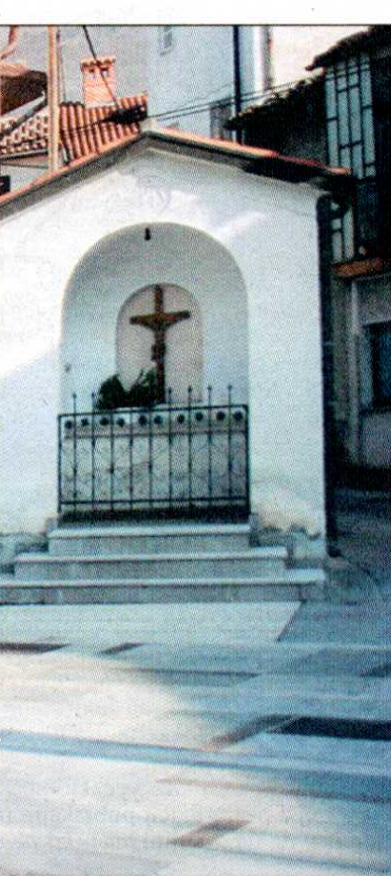
elju slednjič le odkrili spomenik

širile govorice, da sta pobegnila na Cerkljansko. Brevir pa je ostal nema priča, kdo počiva v svežem skrivnostnem grobu. Dobro leto pozneje, preden je prišel ukaz iz Škofje Loke, smo doma sklenili, da ju prenesemo na domače pokopališče, kamor tudi spadata. Sam sem šel, trupli odkopal in vse primerno pripravil za pogreb. Lahko si mislite, kako je vse to bilo videti.”