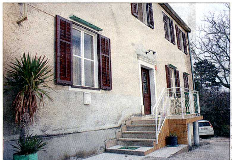
Rojstna hiša stoji v Grivčah, od koder se ponuja prelep razgled na Čaven, Školj in Ajdovščino. Terčelj je na dom rad povabil svoje prijatelje, ki imajo Grivče zaradi gostoljubnosti v zelo lepem spominu.