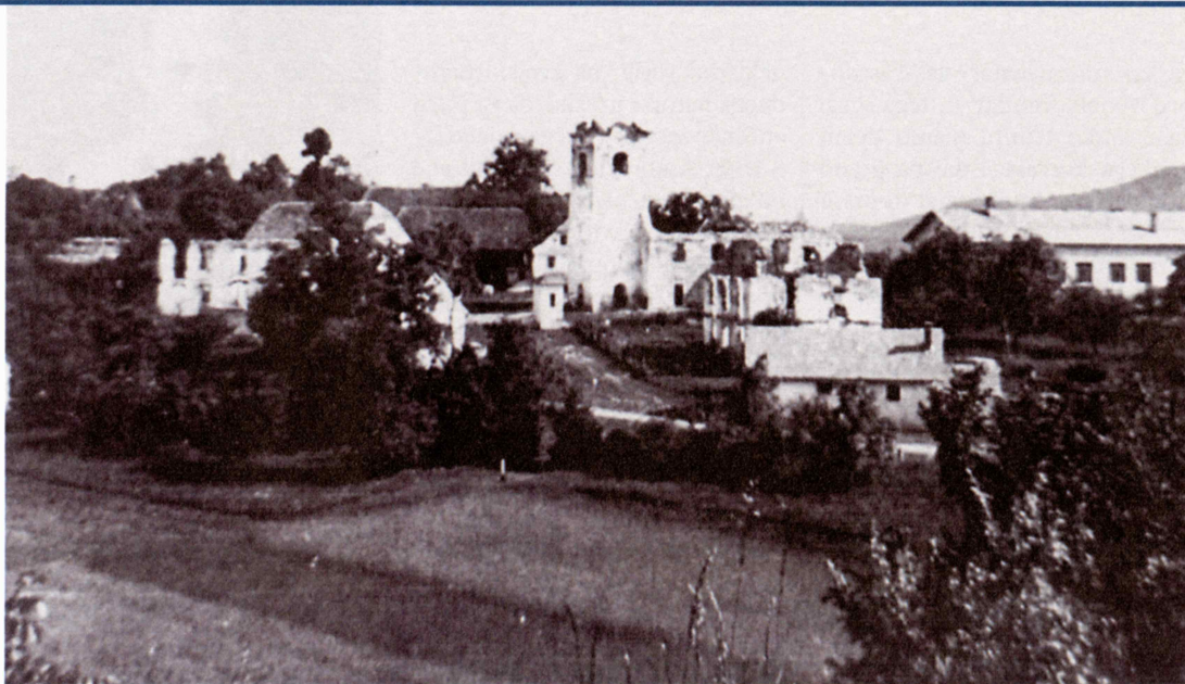
Ajdovec po vojni