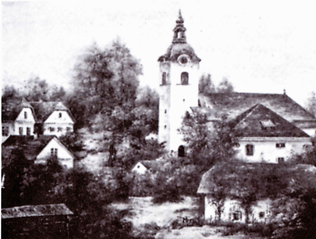
Župnijsko središče v Ajdovcu pred komunističnim uničenjem