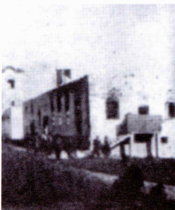
Požgani Gnidovčev prosvetni dom