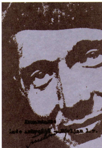
Podpis Lada Ambrožiča-Novljanja

Uničenje Štanjela Spomnimo se samo, kako so v Štanjelu septembra 1944 partizani razstrelili dvanajst