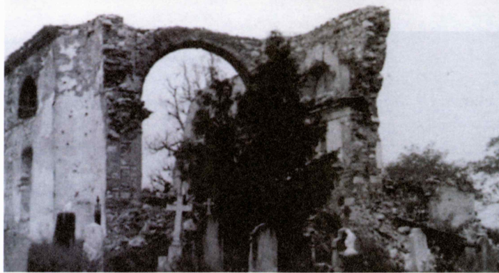
V Hinjah so za partizani ostale ruševine požgane in minirane cerkve.