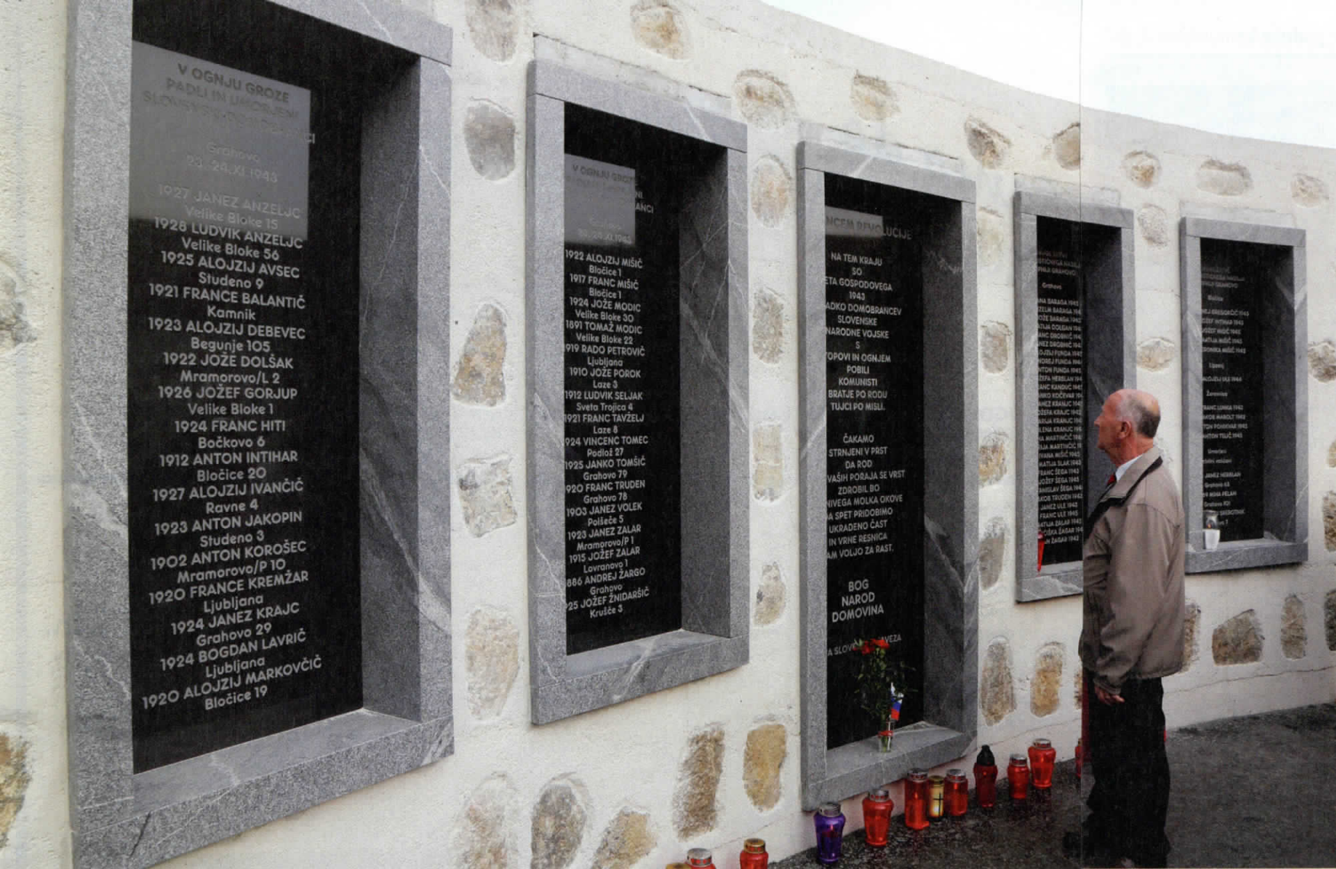
Spomenik tistim v Grahovem, ki so jih umorili partizani