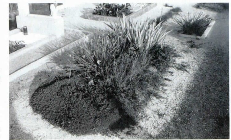
Vse do leta 1990, 45 let torej, Balantičev grob v Grahovem ni mogel biti označen. Rdeča peščica Kamničanov bi ga še vedno prepovedovala.