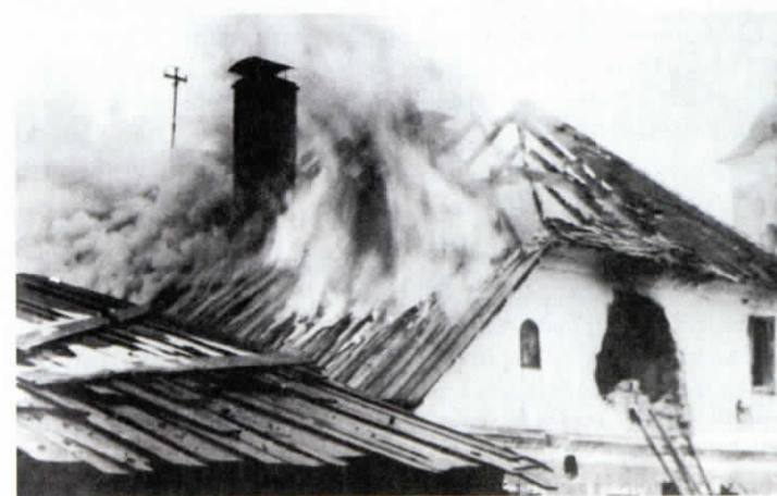
Grahovo, partizanski ogenj, ki je zažgal pesnika Franceta Balantiča; podoba za tisto peščico Kamničanov, ki nasprotujejo velikemu poetu

Poglejmo tri primere državljanskih vojn po svetu. Med ameriško v 60. letih 19. stoletja sta se med seboj borili dve sili znotraj današnjih ZDA. Med rusko po boljševistični revoluciji sta se prav tako borili dve sili znotraj