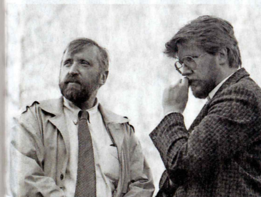
Po Igorju Bavčarju Omerza pripravlja še knjigo o Dimitriju Ruplu.