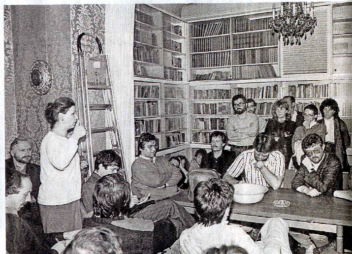
Ustanovitev Odbora za varstvo človekovih pravic v prostorih Društva slovenskih pisateljev.