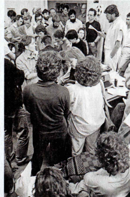
Ustanovitev Odbora za varstvo pravic Janeza Janšea na Mladini.