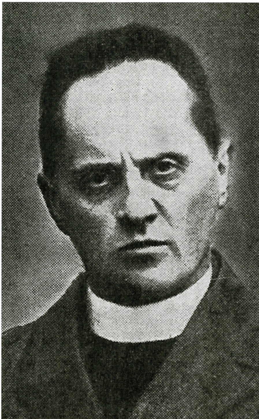
Načrtovana žrtev prof. Lambert Ehrlich