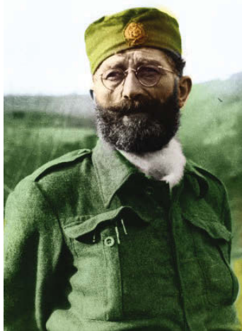
Draža Mihailović je bil za Josipa Broza-Tita pomembnejši nasprotnik kot nacistični okupatorji.