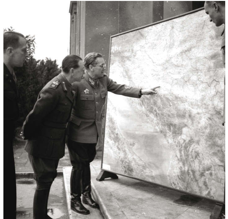
Številne britanske misije so se zanašale samo na »partizanske vire« ter tako pošiljale prirejene in lažne podatke. Na fotografiji britanski feldmaršal Harold Alexander in Tito skupaj razpravljata o situaciji v Jugoslaviji in zavezniški pomoči partizanom.