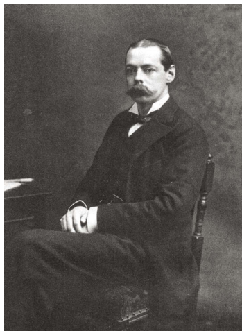
Churchill je poslal v misijo k jugoslovanskim komunističnim partizanom tudi svojega sina Randolpha.