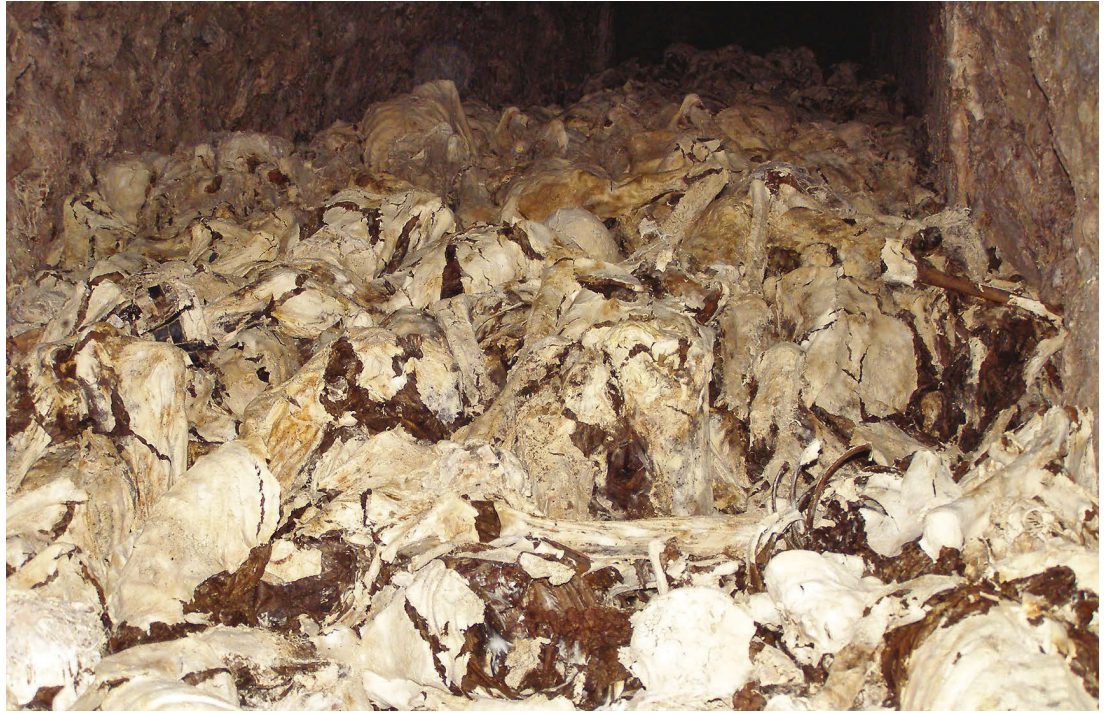
Britanci so verjeli Brozu in tako poslali v Jugoslavijo ter s tem v smrt sto tisoče protikomunistov.

Skratka, fundacija, ki ohranja »lik in delo« Churchilla, se je postavila na stališče, da je njihov idol deloval tako, kot mu je narekovala realpolitika, in torej ni bil prevaran. Da je podpiral Broza zato, da ne bi vznemiril Stalina, ker je bil zveza s Sovjetsko zvezo pač ključnega pomena, Stalin pa je podpiral Broza. Zapisali so, da je bil seveda Churchill antikomunist in prav tako tudi Mihailović. A to še ni bilo zadosti, da bi Churchill Mihailovića še naprej podpiral. »Vojna je umazana in