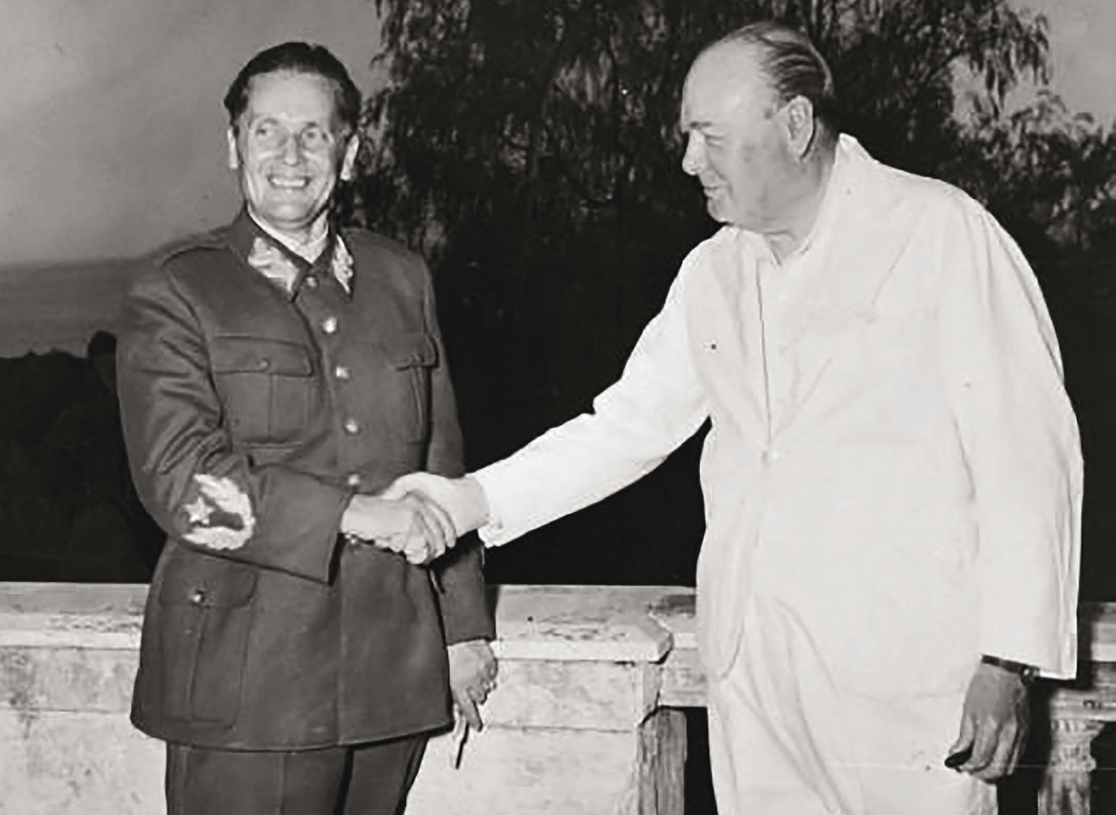
Josip Broz in Winston Churchill med sestankom 12. avgusta v Neaplju, kjer je bila za desetletja zapečaten usoda Jugoslavije