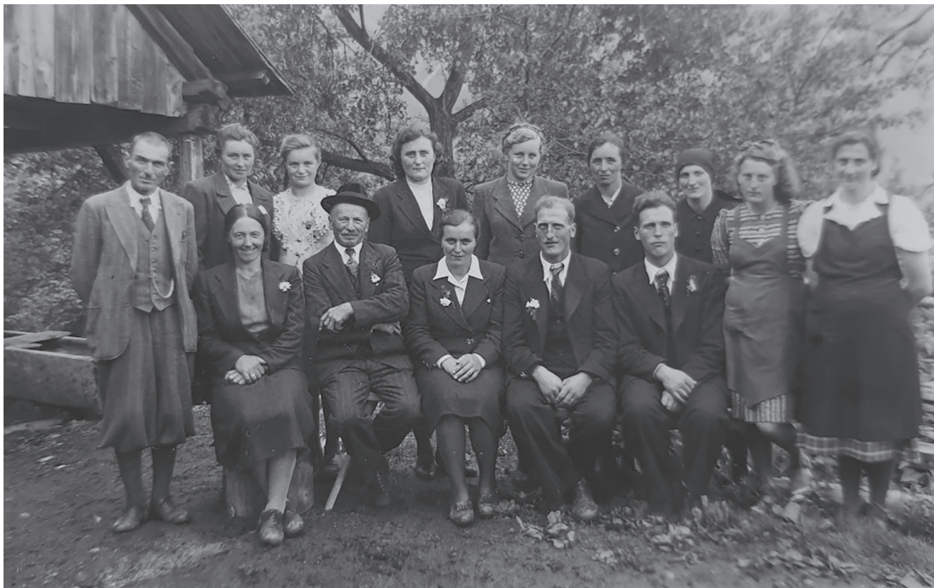
Slika ohceti pred Dvorom pri Merkelnu