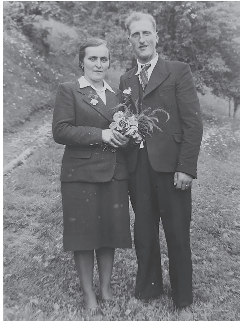
Poročna slika očeta in mame, 10. julija 1944

Izgonu nemškega prebivalstva je spomladi leta 1947 sledil množičen izgon prebivalstva iz obmejnega pasu z Avstrijo. Če je izgon nemškega prebivalstva po vojni iz Slovenije že relativno dobro raziskan, pa tudi vsaj nekoliko prisoten v zgodovinskem spominu (seveda brez vsake-