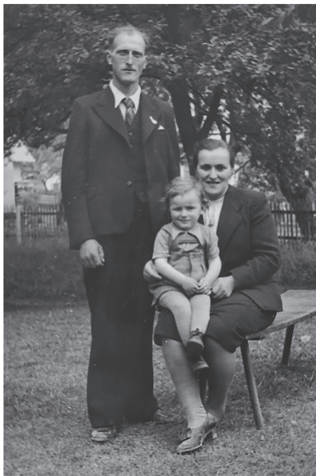
Družina dve leti pred izselitvijo, jesen 1947

Najbolj množični izgoni prebivalstva iz obmejnih krajev so bili izvedeni v letu 1947, nadaljevali pa so se potem tudi v naslednjih letih.