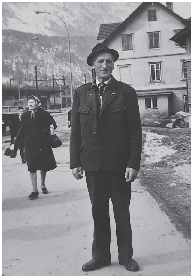
Oče, Jožefov semenj, Jesenice 1975, obleka izpred druge svetovne vojne; nosil jo je več kot 30 let.