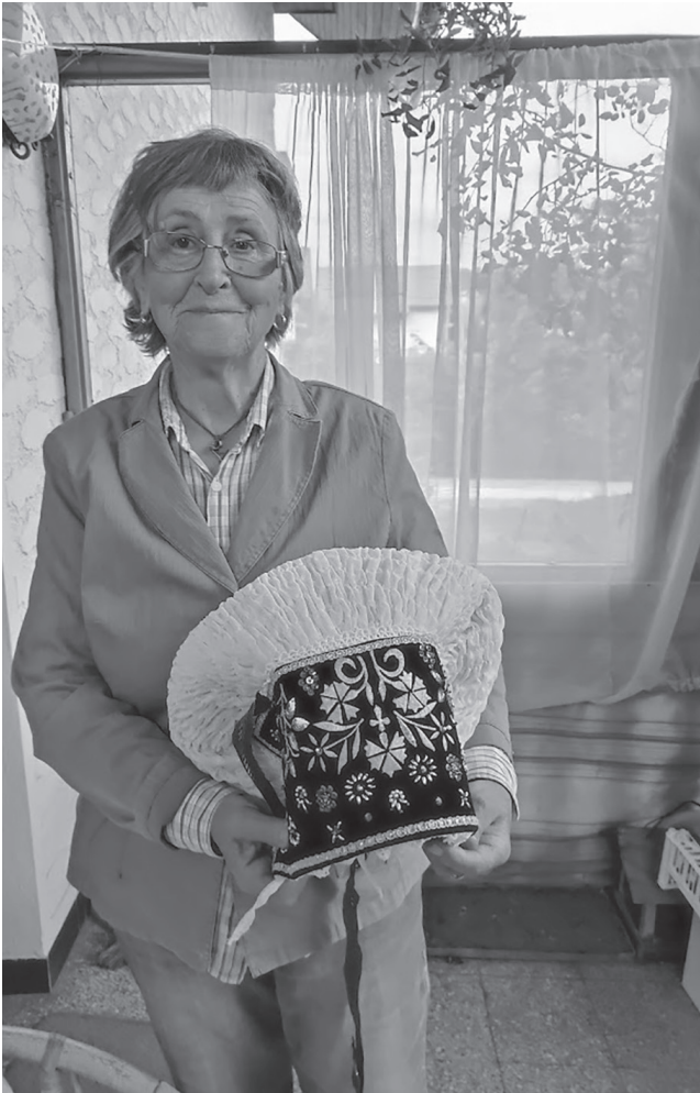
Gospa Marija z avbo, ki jo je sešila sama.