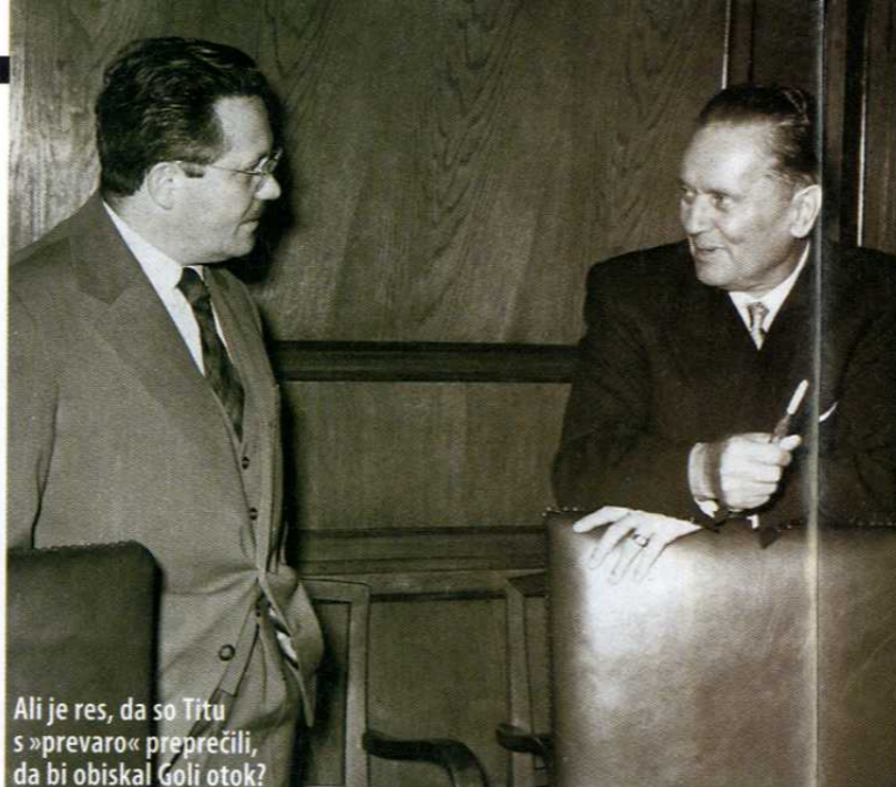
Ali je res, da so Tito s »prevaro« preprečili, da bi obiskal Goli otok?