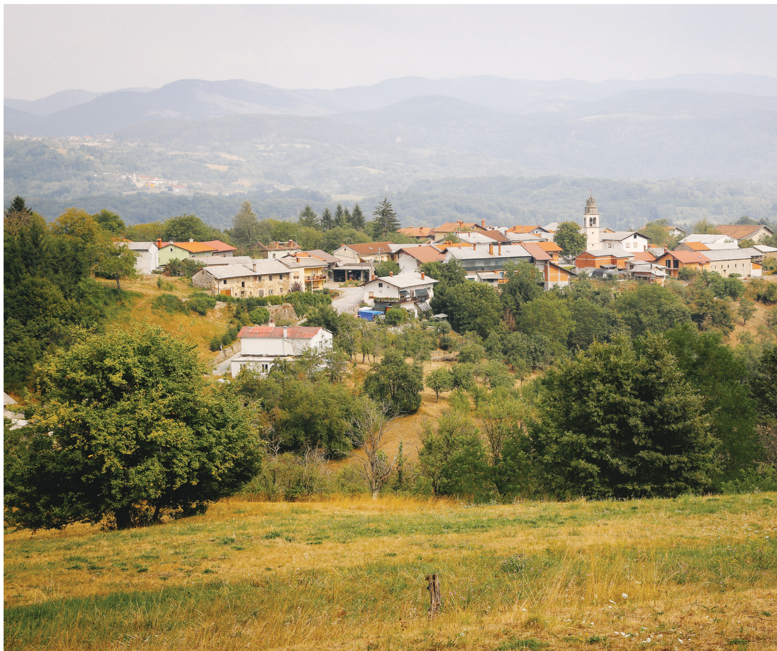
Smrje v Brkinih