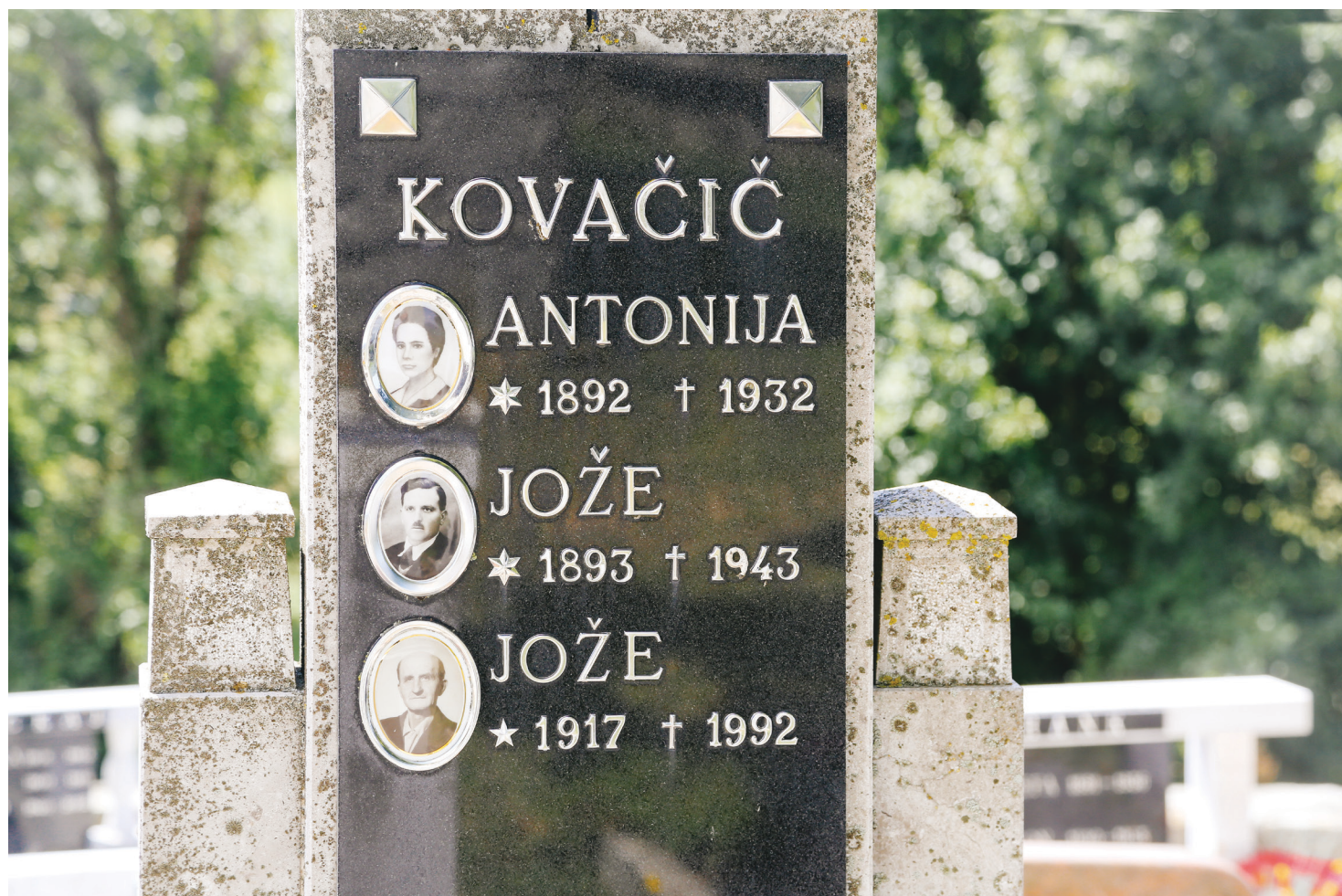
Grob Kovačičevih na Premu

► Kovačič podedoval, drugega pri Trnovem pa dokupil. Posest je razdrobljena v številne manjše dele.