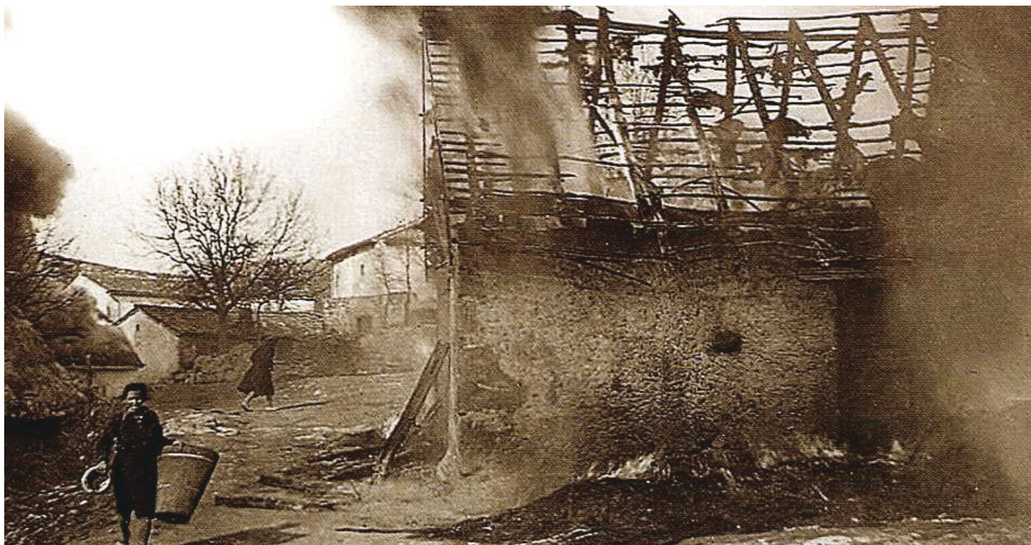
Požig vasi Prelože 12. aprila 1944

► na Nemce, potem pa njihov povračilni ukrep z uničevanjem nemočnih civilistov. Najprej so te civiliste vlekli za nos komunistični partizani, češ da jih osvobajajo izpod dolgoletnega fašizma, morali so jim dajati velike količine hrane in še zavetje, potem pa so za plačilo dobili