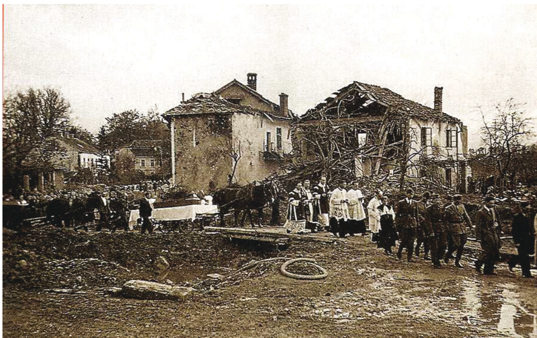
Pogreb žrtev bombardiranja 16. oktobra 1944 v Ilirski Bistrici