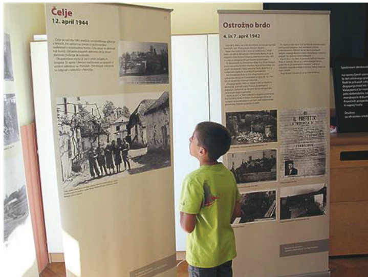
Razstava o požganih brkinskih vaseh. Avtorju podlistka je (v Pregarjah, kjer jo hranijo) kljub mnogim prošnjam niso hoteli pokazati.

Samo na ozemlju današnje občine Ilirska Bistrica, ki obsega pretežni del Brkinov, je med drugo svetovno vojno in komunistično revolucijo bilo ubitih 823 oseb. Od tega 280 v partizanskih vrstah, 298 »civilistov na terenu«, 104 osebe v internaciji, devet je bilo obsojenih na smrt in ustreljenih, 25 pa je bilo civilnih žrtev zavezniških in nemških letalskih bomb. Kar 52 ljudi so umorili partizani (zbornik Občina Ilirska Bistrica , 2011, str. 150). Med njimi je bilo veliko gostilničarjev, trgovcev in drugih premožnejših ljudi, kar dokazuje, da so bili tudi v Brkinih partizani vpreženi v krvavo revolucijo. D