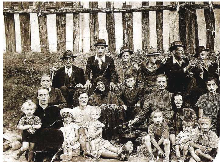
Vaščani Ratečevega Brda v internaciji leta 1942