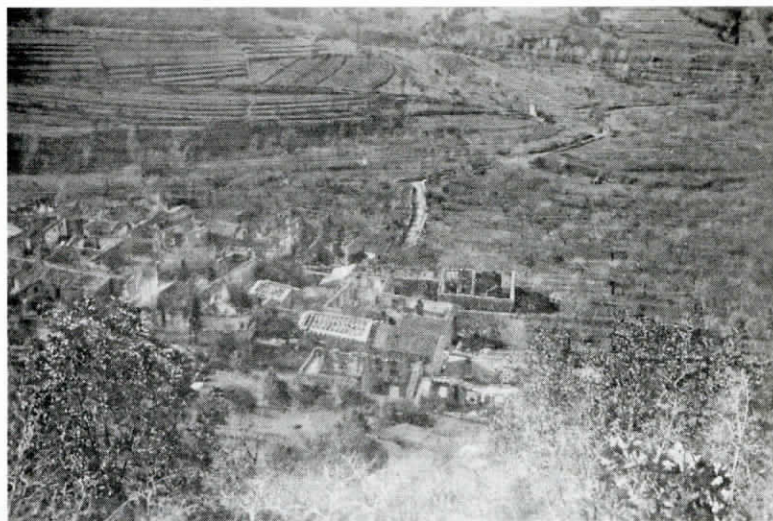
Gabrovico je dan po požigu 29. maja 1944 fotografiral Stanko Pervanje-Gruden.