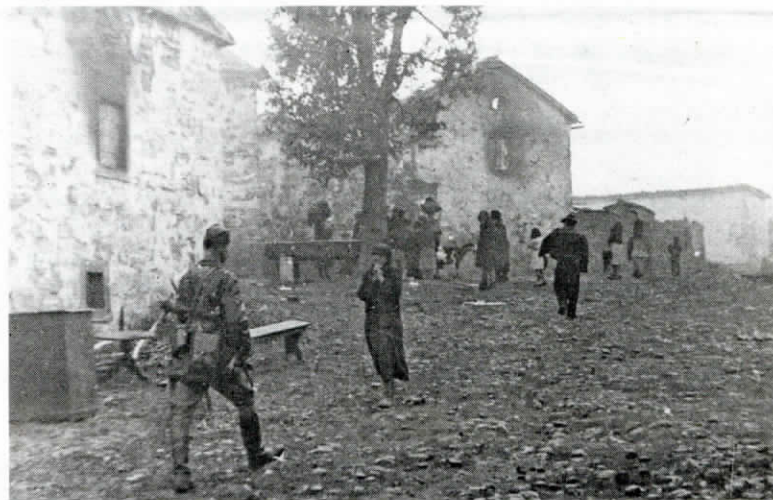
Fotografija je nastala v Tatrah ob odhodu nemških vojakov iz vasi.