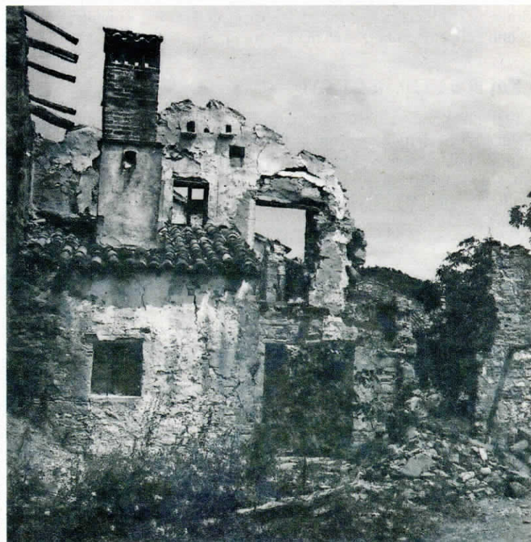
V Goriškem muzeju je shranjena fotografija požiga vasi Slavče.