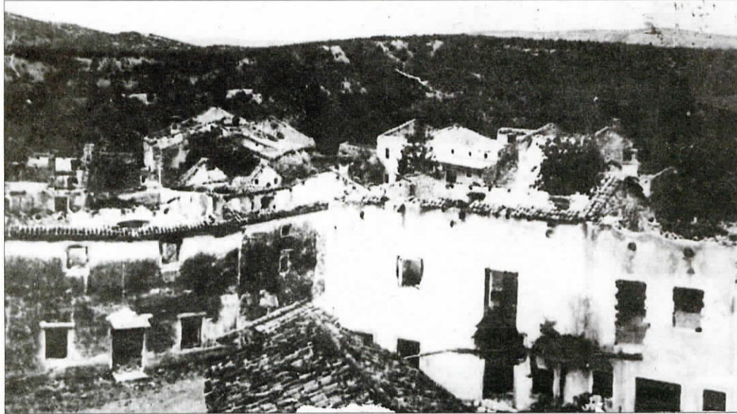
Prizora iz požganih kraških vasi, levo žalosten pogled na Mavhinje