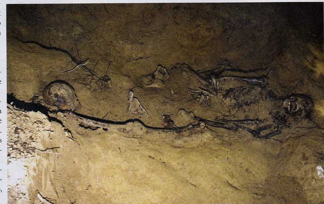
Kriminalistični izkop dveh žrtev 10. junija 2003 v Jelencih pri Šmarjeti na Dolenjskem