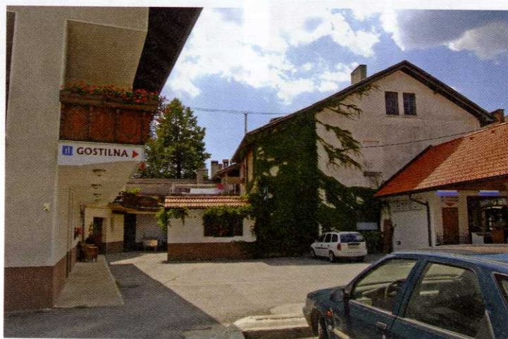
Dvorišče Korenčanove domačije v Logatcu