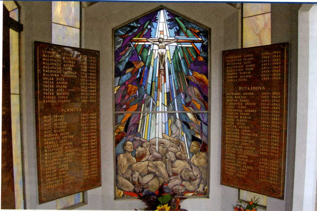
Farne spominske plošče v Šentjoštu