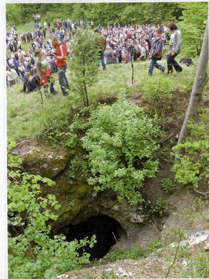
Šemonovo brezno na koncu logaškega polja

takšnega potem ni bilo milosti, bil je umorjen.