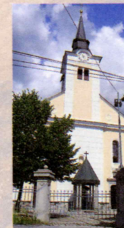
Cerkev Matere božje

niji, vendar je po bogastvu gradiva izjemen. Predstavlja vojno in vojaško zgodovino Slovencev in slovenskega ozemlja od kamnite sekire prek keltskega in rimskega obdobja, srednjega veka ter I. in II. svetovne vojne, vse do vojne za samostojno Slovenijo in razvoja Slovenske vojske. Posebnost muzeja je zbirka več kot 2800 odlikovanj z vsega sveta.