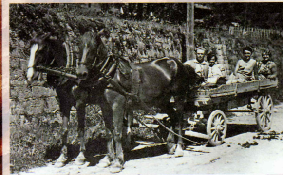
Furmanstvo je predstavljalo glavni vir dohodkov.

Starine in vojaška oprema Vojni muzej Logatec je najmlajši tovrstni muzej v Slove-