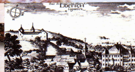
Logatec v Slavi vojvodine Kranjske

19. stoletja. V niši nad vhodom v zakristijo je lesen kip Brezmadežne, ki izvira iz 18. stoletja. Po ustnem izročilu naj bi ga bili v cerkev prinesli v zahvalo neki mornarji.