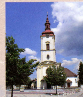
Župnijska cerkev sv. Nikolaja