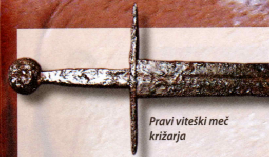
Pravi viteški meč križarja