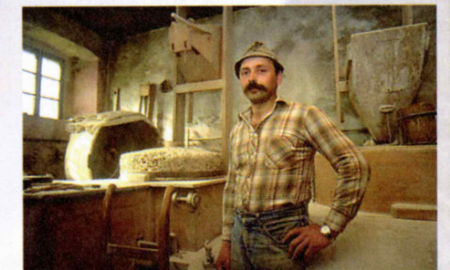
Notranost tradicionalnega mlina

S kolesom po logaški pokrajini Vsi kolesarski navdušenci lahko lepote, kraje in ljudi občine Logatec najbolje spoznajo, če prekolesarijo Logaško kolesarsko transverzalo . Nastala je leta 1997 in je zasnovana tako, da vključuje zanimivo turistično ponudbo, izjemne naravne danosti ter zanimivosti logaškega dela Notranjske. Dopušča spoznavanje celotnega območja po delih, kar omogoča načrtovanje večdnevni aktivnih počitnic.