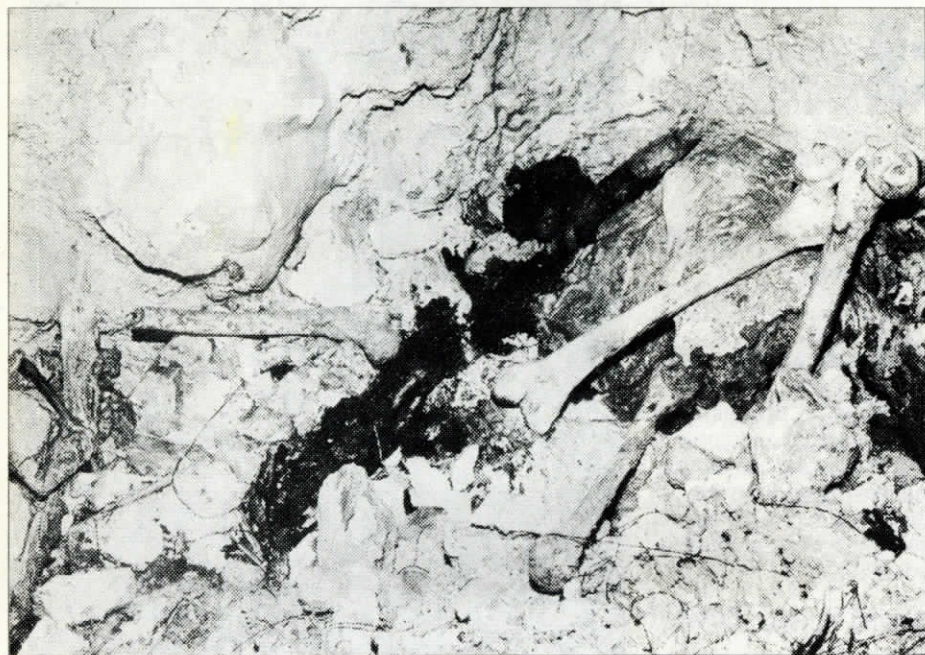
Grobnica neznanih domobrancev: Brezno na Koševcu, kjer so končale žrtve kanibalskega holokavsta

že pospravljala, in rekel, naj mu dam žico, ki jo potrebuje za klanje živine na dveh nogah.»