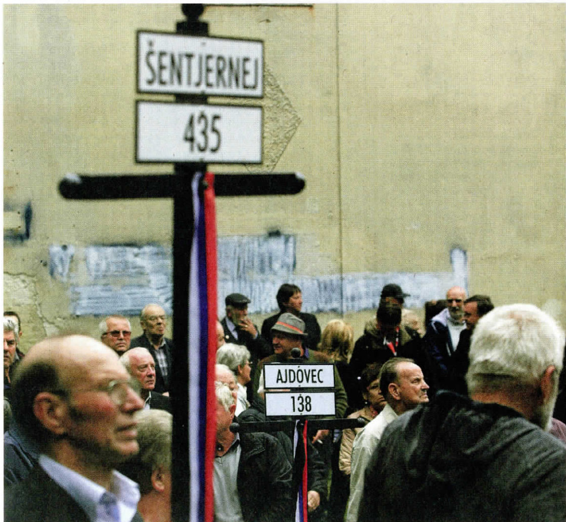
Pokojnim so se poklonili številni svojci in prijatelji.