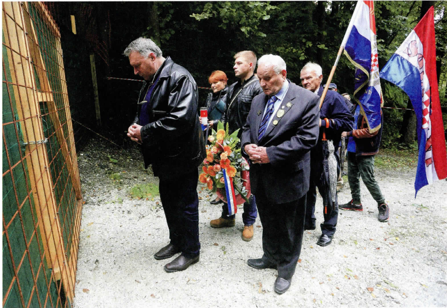
Žalne slovesnosti so se udeležili tudi predstavniki slovenskih in hrvaških združenj.