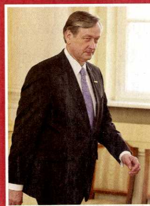
Za slovenskega predsednika Danila Türka je poboj v primerjavi s proslavo ostarelih afežejev drugorazredna tema.