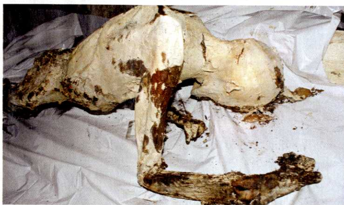
Približno deset odstotkov žrtev v Hudi jami je žensk.

Pojasnila je, da se je kruto vračati v čas, ko so travme nastajale,