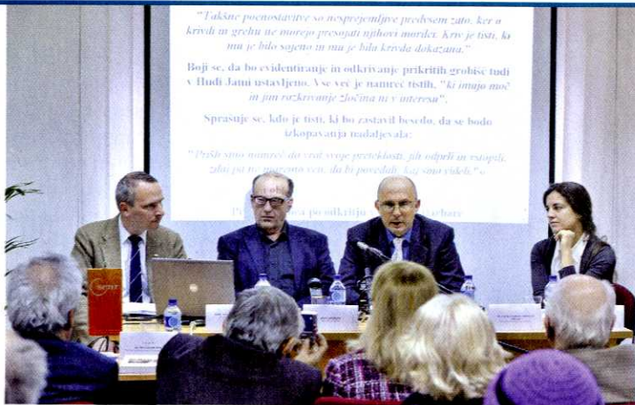
V Študijskem centru za narodno spravo v Ljubljani so pripravili mednarodno srečanje ob drugi obletnici odkritja grobišča v Hudi jami.