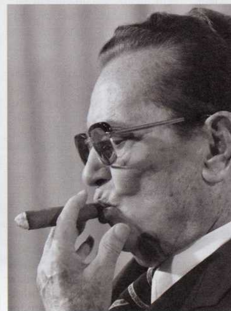
Če je Josip Broz res kriv za povojne poboje, zakaj njegovo ime še ni odstranjeno iz javnosti?

Demokracija je že skoraj pred dvema desetletjema pisala o možnosti obstoja povojnega grobišča v Barbarinem rovu.