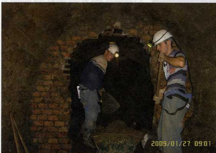
Ocenjujejo, da je v rovu vsaj tristo trupel, lahko pa jih je še veliko več.