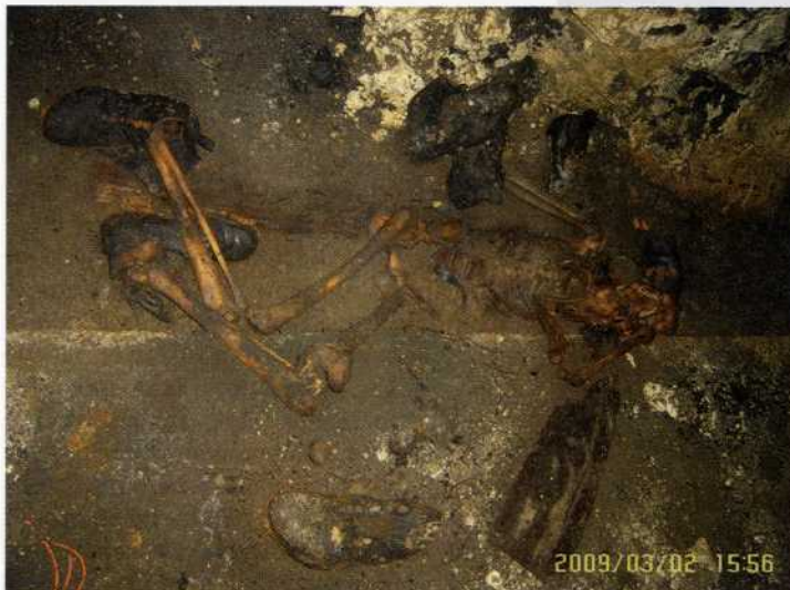
Nekateri skeleti so dobro ohranjeni, indentifikacija večine pa je vprašljiva.