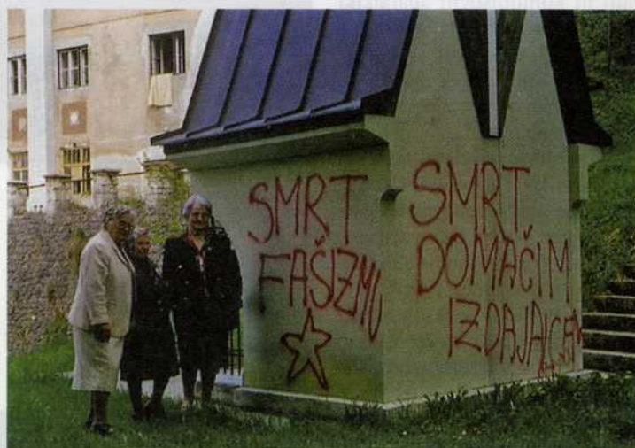
Oskrunjena kapelica; očitno se nekateri anonimni s pokoli globoko strinjajo.

da bodo prišli v naše kraje Anglo-Američani in zavarovali ljudi pred komunistično revolucijo ter poboji in ropanjem, ki jih je ta napovedovala. Sprejeli so pomoč Nemcev pri tem formiranju, saj se partizani, kot se je videlo iz Turjaka in Grčaric, tudi niso branili pomoči Italijanov. Domobrantsko vodstvo je navezalo tudi stike s kraljevo vlado v Londonu, vendar so to zvezo Nemci odkrili in vpletene domobrantske oficirje poslali v koncentracijska taborišča. Zaradi tega domobranci niso dodelili težkega orožja, ker so dobro vedeli, da jim je za Nemčijo malo mar. Čudno, pa takšni dobri sodelavci so bili po partizanskem tolmačenju. S sovjetskimi tanki v Prekmurju in osemstotisočglavo Titovo vojsko, ki se je valila proti Sloveniji, se domobranci brez težkega orožja niso mogli