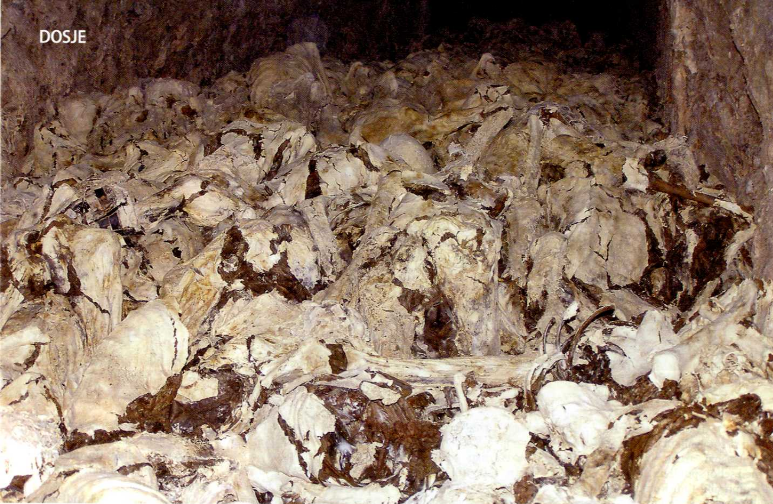
Brezoblična gmota žrtev pokola v Hudi jami.