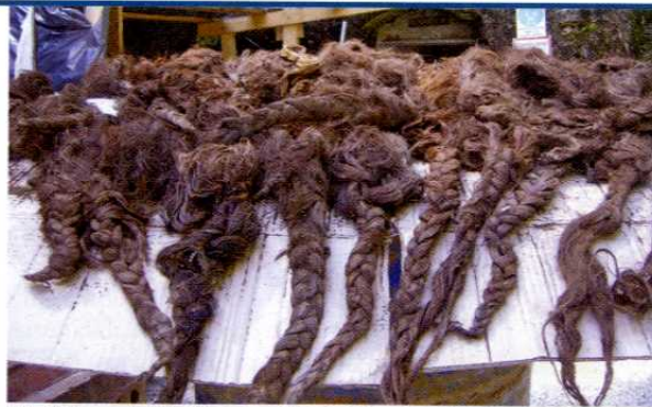
Med žrtvami v Hudi jami so bile tudi številne ženske.

Po iznosu 427 žrtev iz rova je bil kmalu omogočen dostop tudi do prvega jaška. Jasno je bilo, da bodo preiskovalci tudi tam naleteli na žrtve, saj so že na stenah jaška opazili lase, ki so, potem ko so se trupla sesedla, ostali prilepljeni na stene. Po odstranitvi nasutja spet nerazpadla gmota! Stanje, v katerem so bile žrtve, je bilo tudi v jaških podobno in na truplih je bilo še vse vidno in razpoznavno. Preiskovalni sodnik je odredil, naj se posmrtni ostanki iznesejo le v globini petih metrov. In v teh petih metrih je bilo 346 žrtev. Jašek pa je globok 48 metrov. Če togo matematično izračunamo, potem je lahko samo v prvem jašku smrt doletela okoli 3.000 ljudi, in to ne le moških. Med okostji so našli tudi dolge pletene kite in strokovnjaki so potrdili, da je med pregledanimi posmrtnimi ostanki iz jaška deset odstotkov žensk.