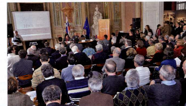
Srečanje ob prvi obletnici vstopa na množično povojno grobišče v Hudi jami potekalo v Muzeju novejšje zgodovine Slovenije v Ljubljani.

Dvojna morala Zanimivo, kako se državni vrhovi različno odzivajo ob podobnih odkritjih množičnih zločinov. V primeru kraškega brezna Konfin 1 na Kočevskem, iz katerega so jamarji iznesli posmrtno ostanke 88 oseb.