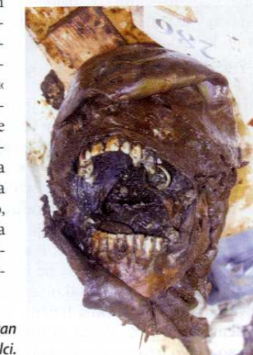
Žrtev je skušala skriti prstan pred roparji in morilci.

Zato se upravičeno pojavlja vprašanje, koliko so v slovenski družbi nasploh zasidrani civilizacijski standardi. Prepogosto je slišati, da so žrtve gotovo bile krive, če so jih pobili. Prepogosto slišimo, da so v prikritih grobiščih le izdajalci, sodelavci okupatorja, ki so si smrt zaslužili. Takšne poenostavitve so nesprejemljive iz več razlogov,