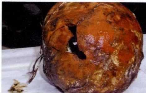
Glave so razbijali tako s krampi kot tudi s krogلامي.