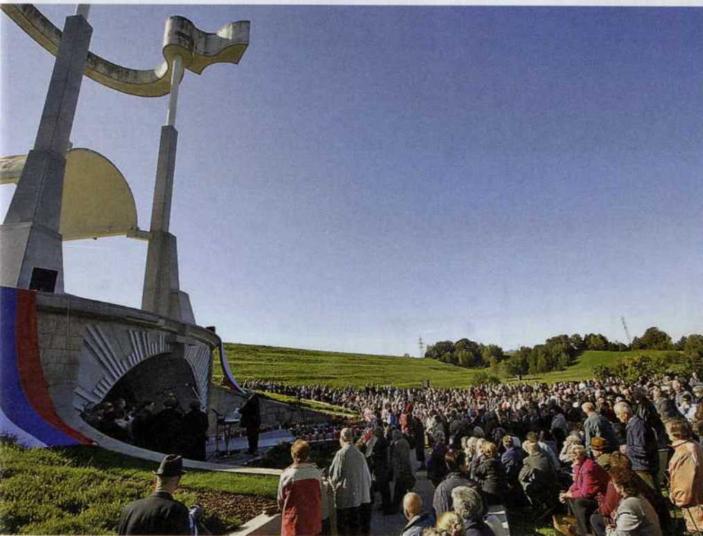
Barbarin rov je tesno povezan z zloglasnim komunističnim taboriščem na Teharjah.

kolikor sem po služenju poznal, so bili sami Savinjšani in tam okrog Trboveljčani.« Ugovšek je potrdil, da se je to dogajalo malo po pobjah jetnikov s Teharij, nekje konec junija, v začetku julija. »Potem pa je bila cela edinica prestavljena iz Celja v Maribor. V Mariboru vem, da je samo enkrat par tovornjakov bilo naloženo, vseh tudi nisem videl. Vem, da je bilo več tovornjakov in to so bili sami civili. Naložili so jih in peljali gor na Pohorje. Tam pa si nisem mogel zapomniti, ker je bilo ponoči in prej nisem bil še nikoli gor. Tudi ne