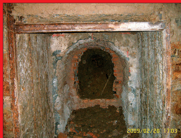
Med enajstimi pregradami v dolžini stotih metrov je bil tudi dvojni betonsko-opečnati zid