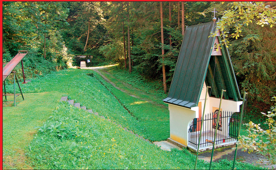
Kapela pred vhomom v rudnik, ki jo je leta 1997 postavilo Društvo za ureditev zamolčanih grobov