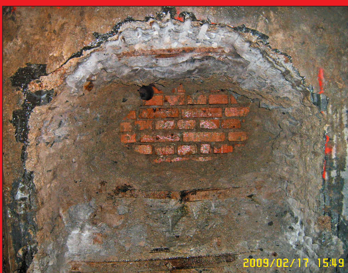
Med enajstimi pregradami v dolžini stotih metrov je bil tudi dvojni betonsko-opečnati zid