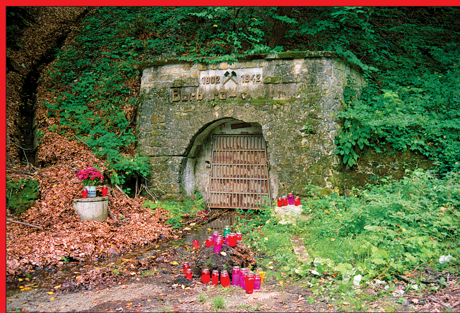
Za temi vrati se je 64 let skrivalo množično grobišče v rudniku premoga, edinstveno v Evropi