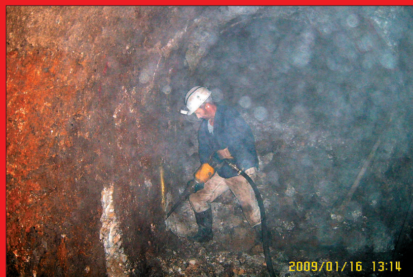
Delavci Rudnika Trbovlje-Hrastnik so se več tednov prebijali do množičnega grobišča v rudniku

Pa ni bilo nič. Prekaljeni borec Starc ni mogel razumeti, čemu se mladi danes zanimamo za izdajalce, ki so jih pobili po koncu vojne. Po njegovem naj bi bili to sami izobčenci, ki niso zaslužili drugačnega konca. Ugovarjal sem in ga vprašal, ali so bili vsi,