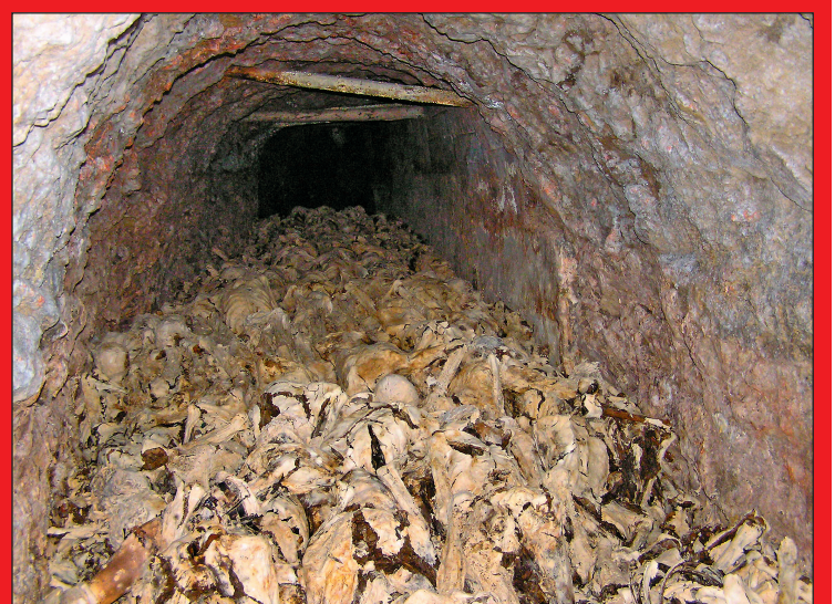
Drugo truplo, na katerega so naleteli pri preboju stometrskega »zamaška« v rudniškem rovu