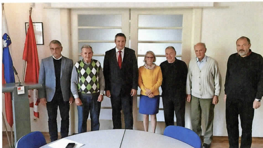
Vodstvo borcev na sedeže SD. Ne manjka tudi drugih znamenj, da »rdeči« računajo na SD.

pritegnila izzivu Nove Slovenije in omogočila sprejem zakona o prikritih vojnih grobiščih in pokopu žrtev, SDS pa se je pri glasovanju vzdržala.