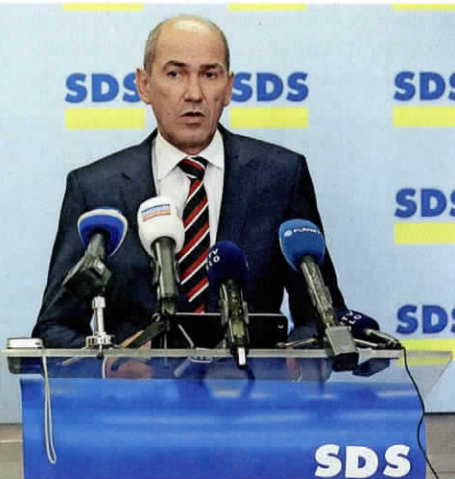
Janez Janša je v intervjuju za Demokracijo izjavil, da je zakon o prikritih grobiščih in pokopu žrtev režimu olajšal nadaljnje sprenevedanje, otežil identifikacijo žrtev in njihovih morilcev.

Če nam niso ljube teorije zarote, gre pri naklepnem scenariju ešalona tranzicijske levece za še eno od faz poglobljanja razhoda med SDS in NSI. Zgodba bo podobna že videni z (domnevnim) zaprtjem arhivskega gradiva. ■