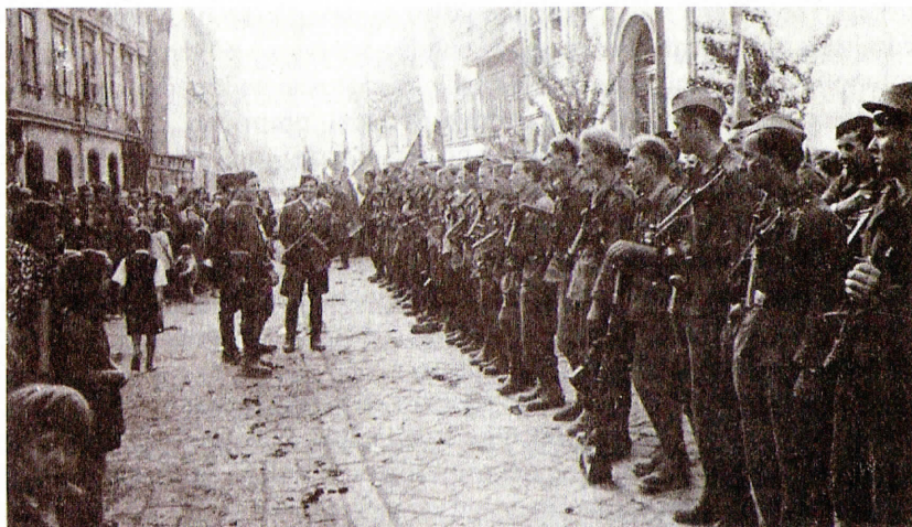
Del tretje brigade Knoja 12. maja 1945 pred magistratom v Celju. Čaka jih velika morija.

Kot je Mikola zapisal v knjigi, se je »zmaga« komunistične revolucije v Sloveniji tudi v Celju najprej manifestirala v obliki strahotnega nasilja, ki ga je takoj po koncu vojne leta 1945 začela izvajati komunistična revolucionarna oblast. »Celje spada med tista slovenska mesta, ki jih je komunistično revolucionarno nasilje najmočnejše prizadelo in ga hkrati tudi za vedno močno zaznamovalo. Celjski zgodovinarji, ki so o povojni zgodovini Celja pisali v času komunističnega režima, tega nasilja sploh niso omenjali, kot da ga sploh nikoli ni bilo, kar velja tudi za tedanjega najvidnejšega celjskega zgodovinarja