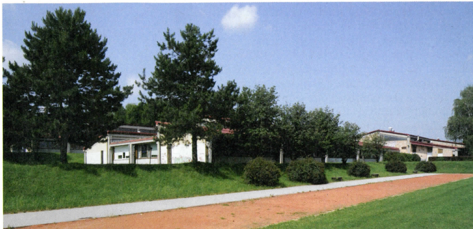
Na množičnem grobišču so komunisti zgradili osnovno šolo.

S komunističnim revolucionarnim nasiljem tudi Celju ni bilo prizaneseno. Takšnega nasilja, kot ga je Celje doživljalo v prvih povojnih letih, ga v vsej svoji zgodovini še ni doživelo. Svoj višek je doseglo v prvih mesecih po končani vojni, ko je tako kot povsod po Sloveniji tudi v Celju potekala operacija »čiščenje«, v okviru katere so bili izvršeni najtežji zločini, med njimi tudi takšni, ki se uvrščajo med zločine proti človečnosti. V okviru te operacije je Ozna ob sodelovanju enot Knoja v Celju že maja 1945 začela izvajati množične aretacije civilistov, jih zapirala v Stari pisker in v koncentracijsko taborišče Teharje, mnoge od njih pa so nato brez vsakega sodnega postopka umorili. Poleg številnih Celjanov je žrtev množičnih pomorov, ki so se v prvih povojnih mesecih dogajali na območju Celja, postalo več tisoč pripadnikov vojaških enot in civilistov z drugih območij Jugoslavije. Med njimi je bilo daleč največ pripadnikov hrvaških vojaških enot, ki so se ob koncu vojne