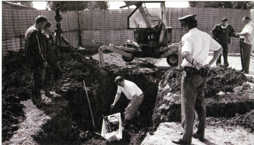
Izkopavanje grobišča na celjskem Golovcu leta 1996