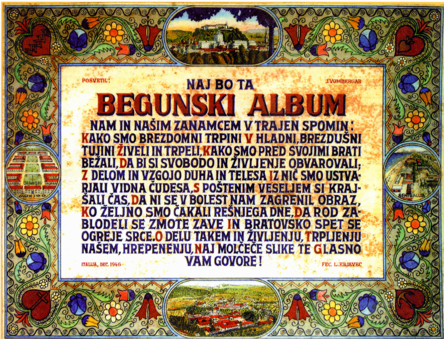
Prva stran albuma beguncev v italijanskih taboriščih 1945–1948