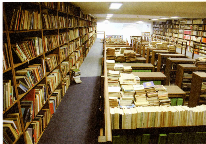
Prostori Studie slovenice danes