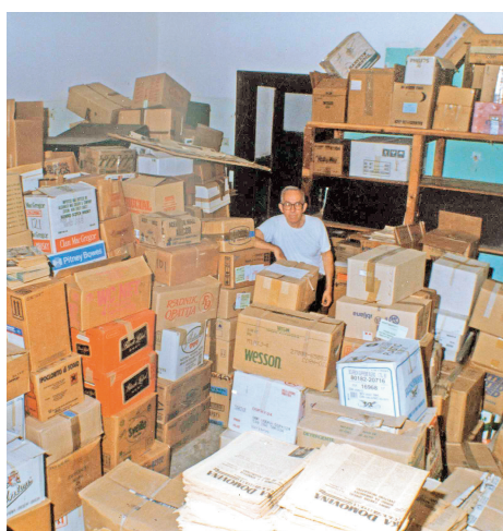
Del skladišča v Zavodu sv. Stanislava