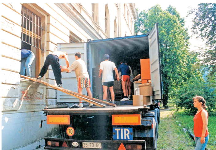
Praznjenje zabojnika v Zavodu sv. Stanislava

Naročila: tel.: 01/360-28-28 www.druzina.si