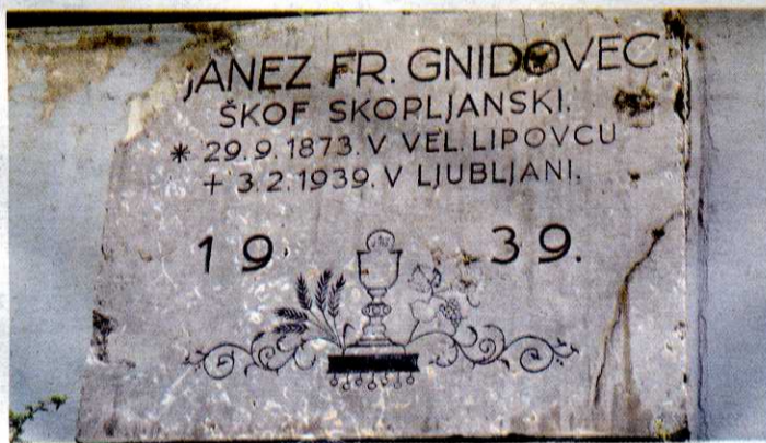
Gnidovčeva plošča, ostanek uničenja leta 1942, s sledovi partizanskih krogel.

Drugi, večji projekt, ki se mu je posvetil župnik Mali, je bila gradnja cerkvenega prosvetnega doma, za prostore