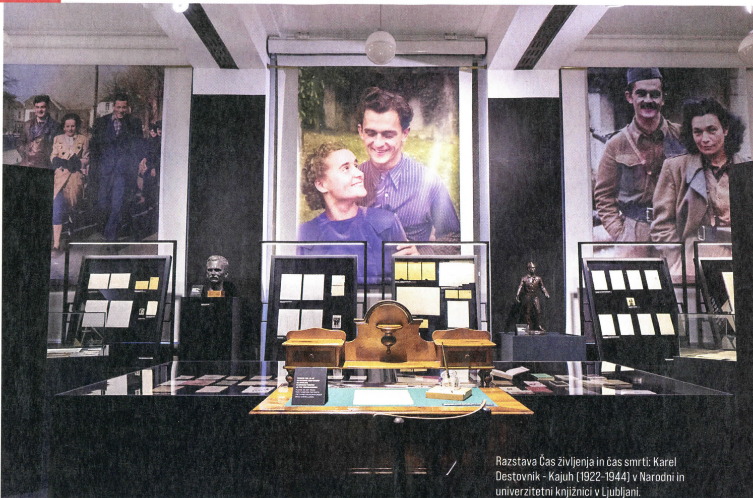
Razstava Čas življenja in čas smrti: Karel Destovnik - Kajuh (1922-1944) v Narodni in univerzitetni knjižnici v Ljubljani.