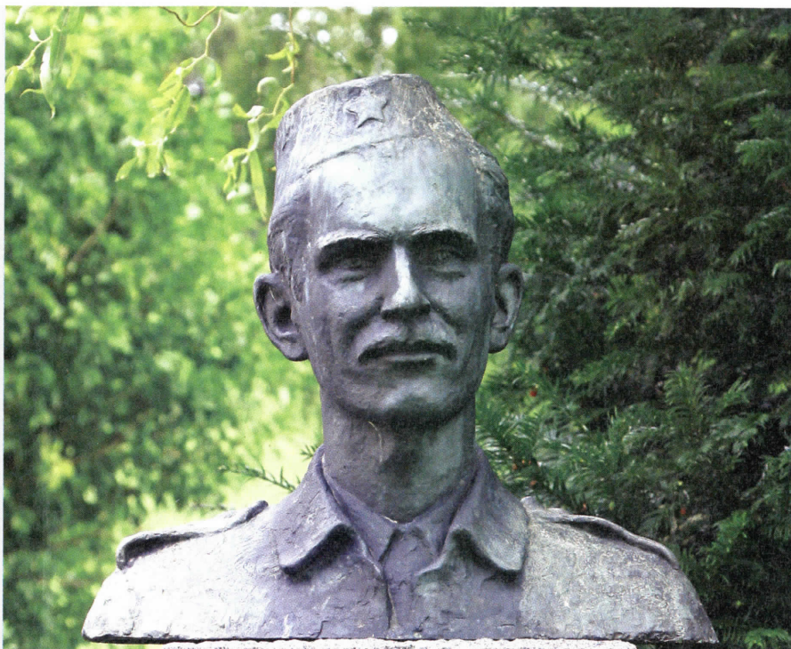
Eden od mnogih kipov revolucionarja, vosovca in pesnika Karla Destovnika - Kajuha; Bele Vode pri Šoštanju.

Kardelj je nadaljeval: »Vodstvo je enotno in je sestavljeno: iz sekretarjev obeh delov in voditelja celotne službe, ki je direktno vezan na CK. /.../ Eksekucijski aparat sestoji iz okrog 50 mož, oboroženih z revolverji in bombami, ki so se dobro izvežbali. /.../ Ti fantje delajo vse mogoče stvari. Nekaj primerov: skoro dnevno padajo denuncianti, okupatorski hlapci itd. Nobena policijska zaščita ne reši tistih, ki jih vosovci (tako jim pravijo tukaj) vzamejo na 'muho'. Vosovci pridejo v restavracijo z revolverji, prosijo navzoče naj dvignejo roke, da jih legitimirajo, ako koga iščejo; aretirajo ljudi na cesti, jih odvedejo in zasljujejo (poklicati Italijane na pomoč se prijete ne upajo, ker je OF izdala odlok, da bo vsak na mestu ustreljen, če bi se obrnil za pomoč na okupatorske oblasti), delajo preiskave po hišah belogardistov, plenijo in zažigajo belogardistični material. Tako so n. pr. vdrli v ilegalno tiskarno Dražinih ljudi, zaplenili tiskarno in črke, s katerimi se sedaj tiskajo OF-ovske tiskovine, in 130 kg papirja. Zasljujali so 3 'tiskarje', ki so vse priznali, zažgali so vse, kar je bilo natiskano, nato so material naložili na avto in se odpeljali. Tako so prijeli tudi neke belogardistične kurirje z letaki proti nam, zaplenili letake in kurirje dobro premlatili.« Nekaj stavkov naprej je zato zapisal: »Varnostne