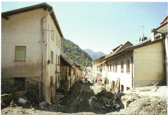
Zaradi naravne nesreče se je moralo iz Ukevi izseliti veliko družin. Mnoge se še vedno niso vrstile na svoje domove.