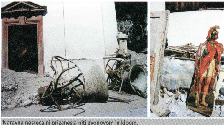
Naravna nesreča ni prizanesla niti zvonovom in kipom.

vedno pa se v Ukvah ni vrnilo več kot 40 družin. Ker gospodarske razmere tam niso rožnate, slovenskim vsem v Kanalski dolini grozi izselitev, s tem pa tudi konec ohranjanja slovenske kulture in jezika v tem delu zamejstva. Zato bi bila finančna pomoč iz Slovenije nadvse dobrodošla. Doslej sta obsežno človekoljubno akcijo poleg društva Planika sprožili slovenski krovniki organizaciji v Italiji, Slovenska kuturno-gospodarska zveza (SKGZ) in Svet slovenskih organizacij (SOO), nanjo pa so se že odzvali nekateri Slovenci in organizacije iz matične domovine, na primer Svetovni slovenski kongres.