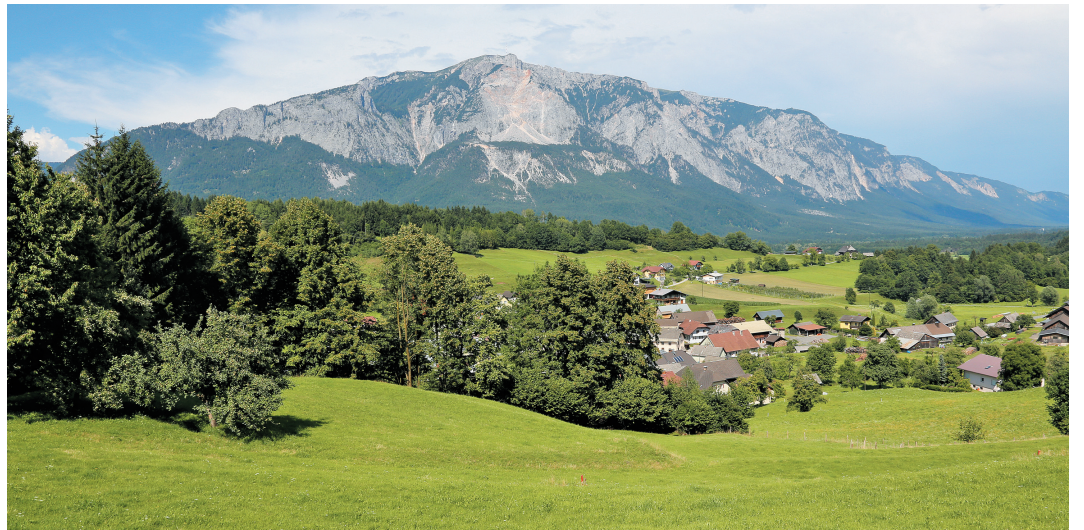
Dobrač se dviga 1.500 metrov nad Ziljsko dolino; pogled z Gorij.

Na severozahodnem koncu slovenskega narodnega ozemlja, med Ziljskimi Alpami in Dobračem na severu ter Karnijskimi Alpami na jugu, ob bregovih zelenomodre Zilje, ki priteče izpod tirolskih gora, ležijo številne vasi in zaselki, kjer se še z zadnjimi močmi krčevito ohranjajo slovenska beseda, pesem in običaji. Nekoč so bili mnogi Ziljani kmetovalci in furmani, ki so iz Ziljske doline prevažali blago na Tržaško, od tam pa v zame-no uporabno blago.