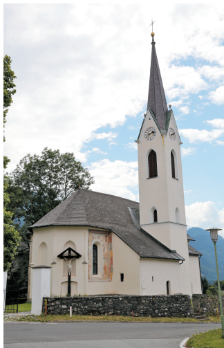
Brdo v Ziljskih brdih je zadnja slovenska vas v Ziljski dolini.