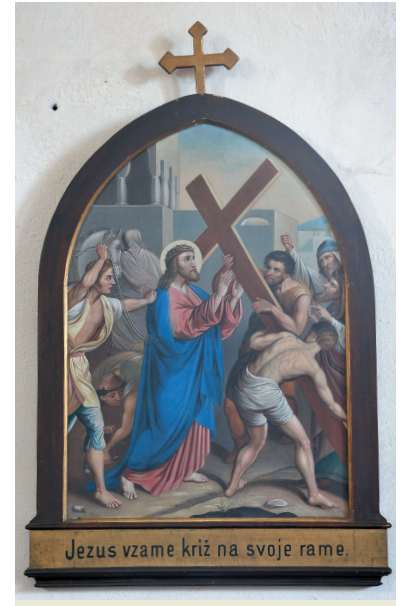
Slovenski križev pot v bistriški cerkvi