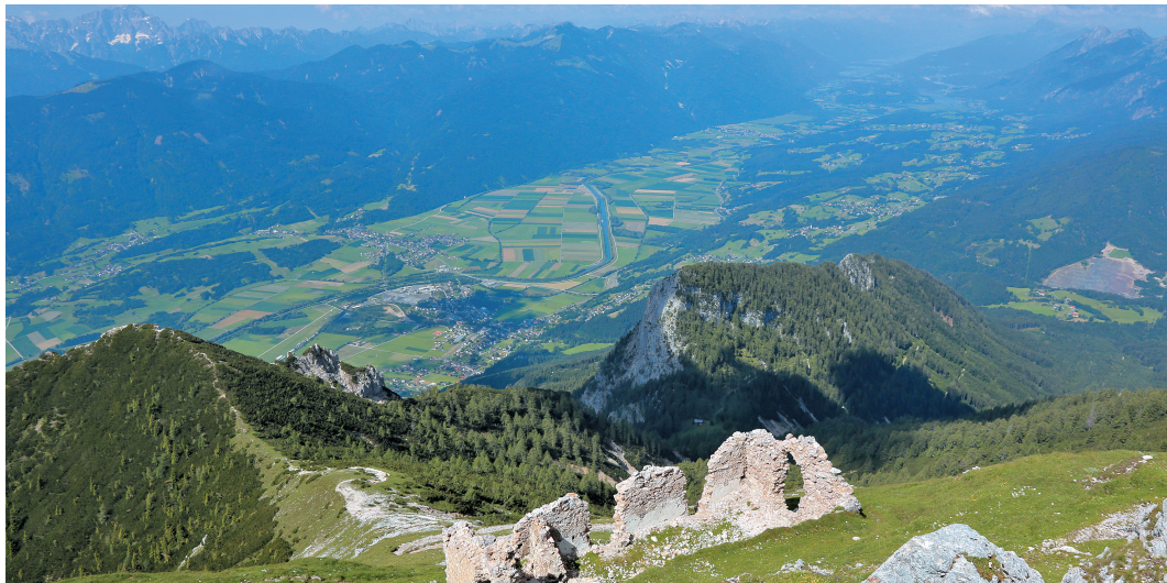
Pogled na ziljsko dolino z Dobrača

V Ziljski dolini, na zahodni jezikovni meji, se še sliši slovenska beseda in pesem.