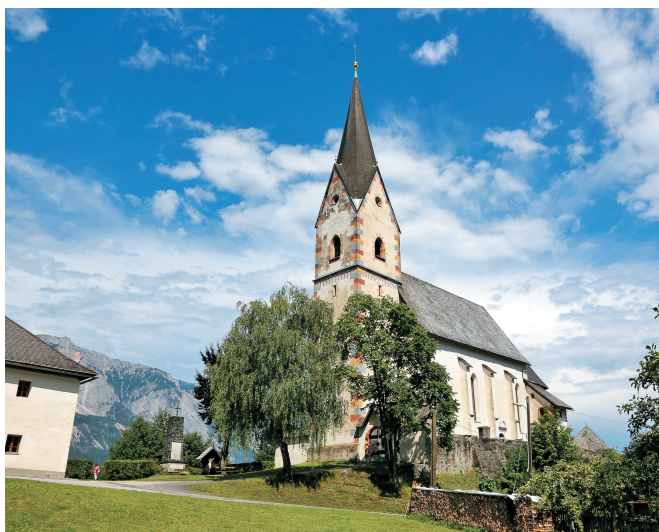
V Gorjah pri Bistrici se na vrhu hriba pne v nebo Marijina cerkev.

Štehvati pomeni sodelovati kot tekmovallec pri šegi, da se med ježo v diru razbija na kol nasajen sodček.