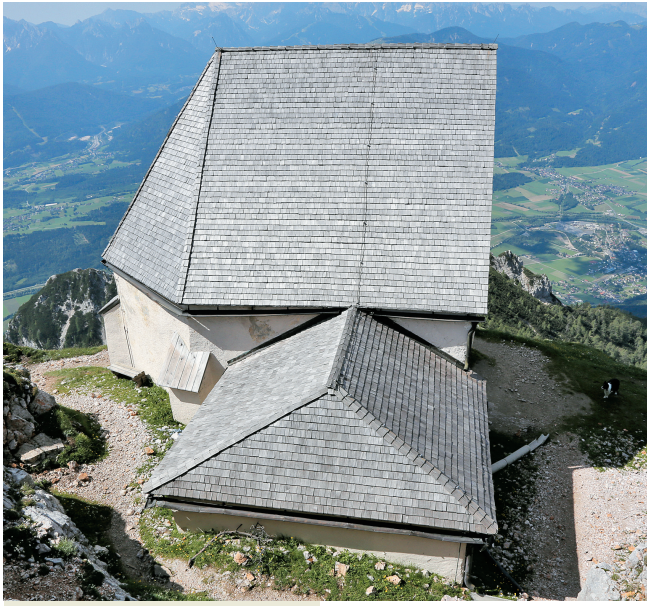
Slovenska cerkev na Dobraču