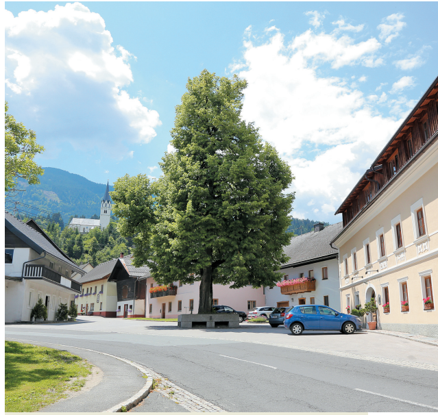
Bistrica je danes središče slovenstva v Ziljski dolini.