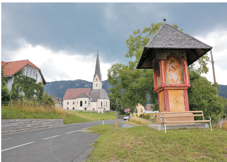
Štefan na Zilji je znan s svojim starodavnim znamenjem.