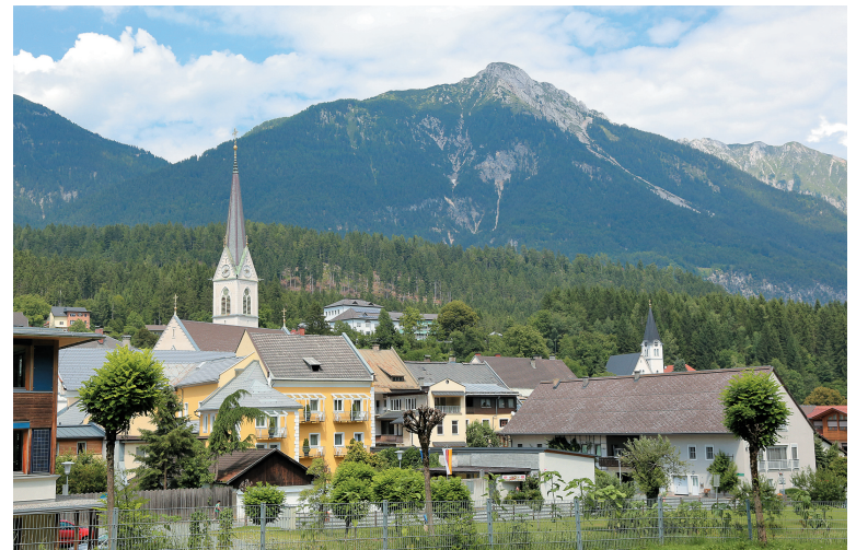
Šmohor je središče Ziljske doline; danes je povsem nemški.