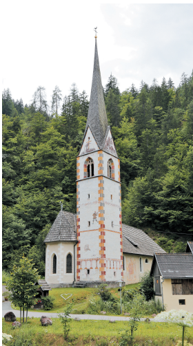
Marijina romarska pot Marija v Grabnu pri Blaču