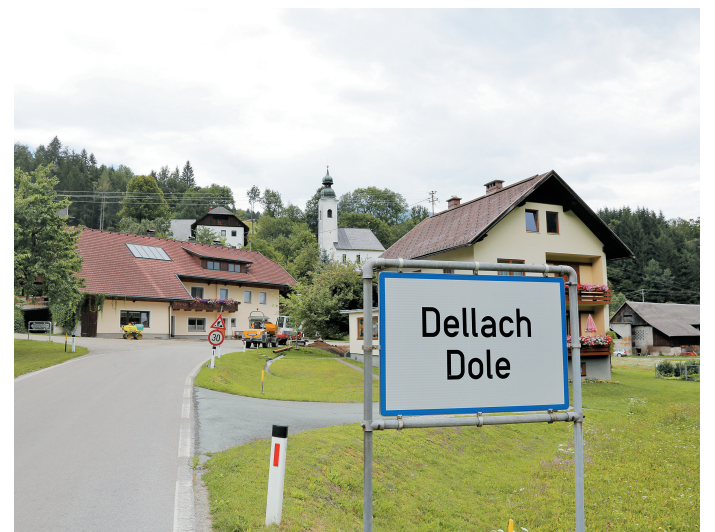
Dole v Ziljskih brdih so ena redkih vasi z dvojezično krajevno tablo.