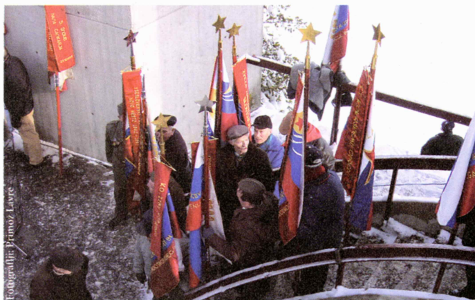
Dečici prejšnjega režima so ostali na oblasti in zato potrebujejo legitimiteto iz tako imenovane NOB, ker je iz propadle revolucije ne morejo črpati.

Kardelj je zato lahko le tragična zgodovinska oseba, ker je za propad-