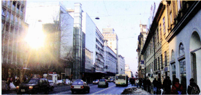
Razvojni problem Slovenije je, da misli še vedno v veliki meri s starimi pojmi.

hotela odpravljati položajev politični, ekonomski in menedžerski eliti iz obdobja socializma, ki je hitro sprejela vse tiste temeljne spremembe v vrednotah, ki so za kapitalizem značilne. Na področju drugih oblik zavesti pa je ostala pri starih, v socializmu porojenih vrednotah. Zelo dobro je začutila, da vrednote in celo simboli, kot so spomeniki, legitimirajo sistem in da sistem v celoti pade in s tem njegova elita, ko padejo njeni simboli in njene vrednote. Zato se je ta elita hitro prilagodila v tistih ekonomskih in političnih parametrih, ki so za delovanje sistema nujno potrebni, na vseh drugih področjih in oblikah zavesti pa se je strogo držala vsega starega. Zato ni producirala novih pojmov, novih miselnih kategorij, novega duha ali celo nove ideologije, s katerimi bi pokrivali, mislili in reflektirali novo nastalo družbo. Privolila je celo v parlamentarno-pluralno demokracijo, čeprav jo je v času socializma zaničevala. V velikem delu se je spremenila v socialdemokracijo, čeprav jo je v času socializma zaničevala in prepovedala. Pri tem obračanju in sprenevanju ni imela nobenih težav ali zadržkov. Toda v tistih oblikah zavesti, ki so bile