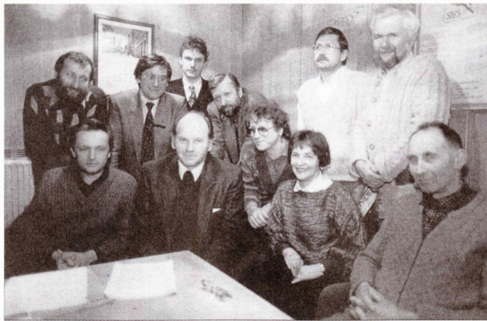
Nova politična elita se je v Sloveniji z Demosom sicer pojavila, ni pa imela nobenih pravih ekonomskih virov moči.

Značilnost propada socializma je ta, da v ideologiji in zavesti ni bil zadosti teoretsko pripravljen. Sesul se je skoraj sam od sebe. Razni disidentje, ki so delovali bolj kot posamezniki kakor organizirane skupine, so socialistični sistem reflektirali, dokazovali njegovo nizko učinkovitost in nedemokracijsko, toda niso bili povezani v neke močne organizirane elite. Tega totalitarni sistem ne bi prenesel. Ko pa se je ta sistem v temelju podrl, ni bilo nobene alternativne močno organizirane elite, ki bi prevzela oblast. Tako je politična, ekonomska, finančna in predvsem menedžerska elita ostala na oblasti in je obdržala vse pomembne pozicije moči. Danes vemo, da se nobena elita iz prejšnjega socialističnega sistema v nobeni vzhodnoevropski državi ni obdržala v tolikšni meri, kot je to primer v Sloveniji. Nova politična elita se je v Sloveniji z Demosom sicer pojavila, ni pa imela nobenih pravih ekonomskih virov moči. Poleg tega ni imela nobenih političnih izkušenj, glede na revanšistične očitke pa se je obnašala izredno demokratično in ni