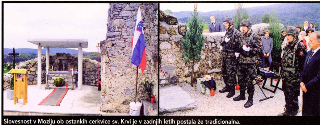
Slovesnost v Mozlju ob ostankih cerkvice sv. Krvi je v zadnjih letih postala že tradicionalna.

uveljavljanje neomajne moči in strahu. Sprva le besedna vojna je čedalje bolj preraščala v krvavo obračunavanje. Vrh je doseglo z napadom na centralni četniški odred Jugoslovanske vojske v domovini v Grčaricah ob kapitulaciji Italije v septembru leta 1943. Z odločilno pomočjo italijanske artilerije so partizani napadli odred in ga prisilili k vdaji. Pomoč italijanske artilerije dokazuje sodelovanje partizanov z okupatorjem, pri čemer je pomembno, da so partizani dovolili celotni italijanski armadi, ki je na ozemlju Slovenije zagrešila veliko vojnih zločinov, prosto vrnitev v Italijo. Ujete vojake, podoficirje in oficirje JVvD so odpeljali v zapore v Kočevje, težke ranjence odreda pa so po vdaji ustrelili. Oktobra