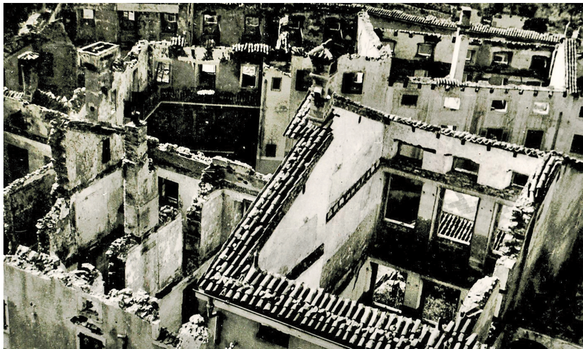
Za partizani in Nemci je ostal požgani Komen