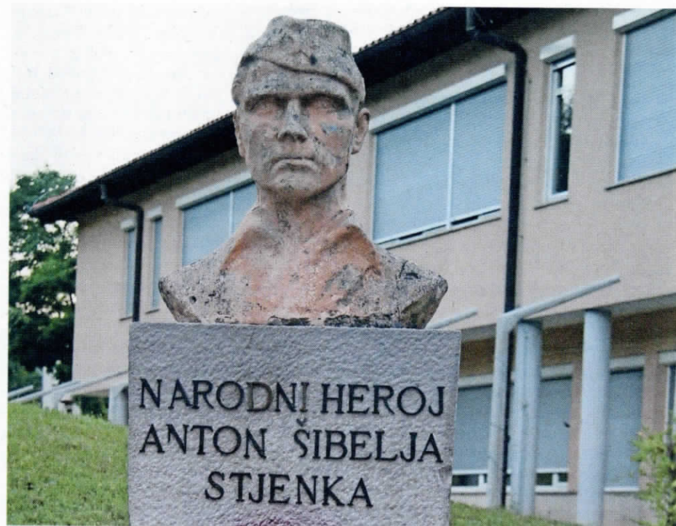
Osnovna šola Komen se zdaj imenuje po narodnem heroju Antonu Šibelju Stjenki