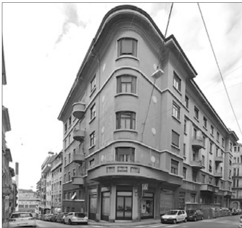
Stavba v Ul. Rossetti, prizorišče umora