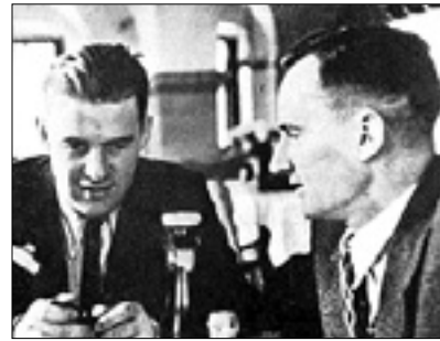
Nacistična prvaka Odilo Globočnik in Friedrich Rainer na Dunaju leta 1938