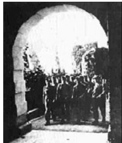
Primorski domobranci na podčastniškem tečaju na Devinskem gradu