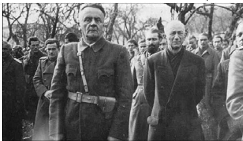
Vojvoda Dobroslav Jevdjević s svojimi četniki v Sloveniji leta 1944

vrednotam, Trst 2012, str. 81), je goriško skupino zalagal z denarjem tudi četniški vojvoda Dobroslav Jevdjević. Ameriško obveščevalno poročilo s 26. junija 1947 ve o vojvodi, ki je že zelo zgodaj v Bosni sklenil z Italijani sporazum o vzajemnem nenapadanju, povedati, da je med nemško zasedbo Trsta bival in ... uradoval v mestu ob zalivu v Hotelu Continental v središčni ulici San Nicolò, odkoder je januarja 1944 začel sodelovati z Nemci v