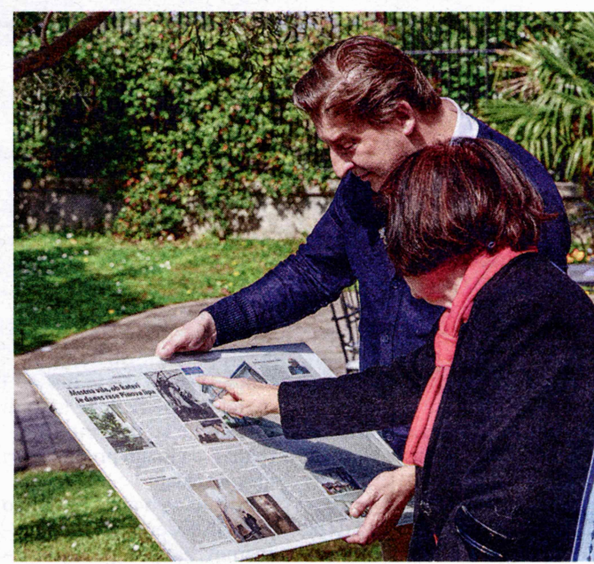
Iz arhiva Konzul je pokazal uokvirjen članek o stavbi LT